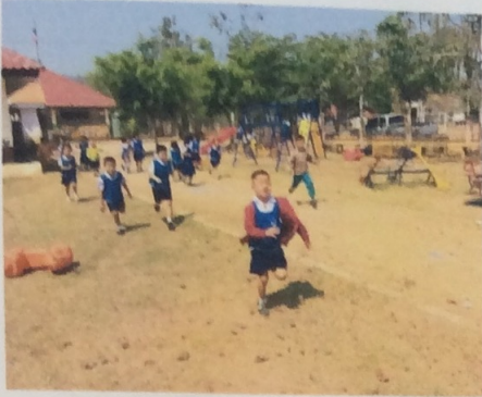
วิ่งและหยุดได้ทันที