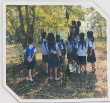
สนใจธรรมชาติและสิ่งแวดล้อม