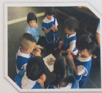
เล่นร่วมกับเด็กคนอื่นได้