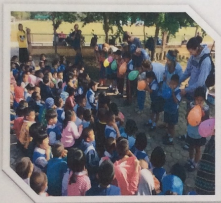
สามารถคอยการเล่นและการปฏิบัติกิจกรรมตามลำดับก่อนหลัง