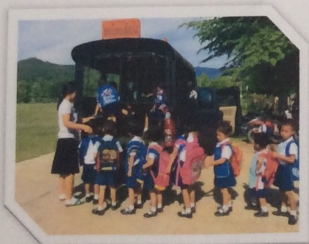
ปฏิบัติตามข้อตกลงร่วมกัน