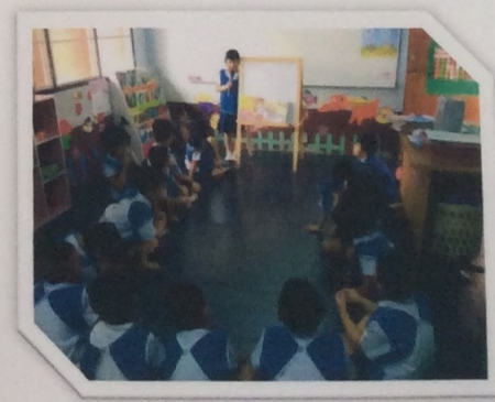
เด็กสามารถเป็นผู้นำผู้ตามได้