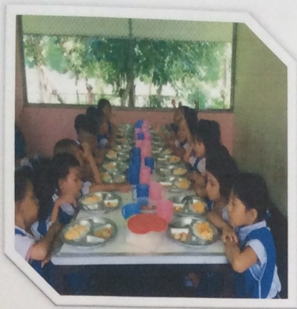
รับประทานอาหารได้ด้วยตนเองโดยไม่หกเลอะเทอะ