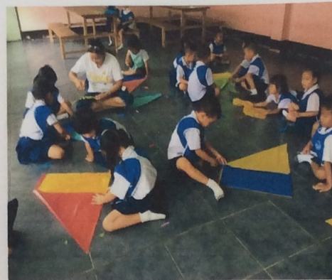
ตัดกระดาษตามแนวเส้นตรงได้