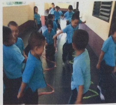
กระโดดขาเดียว