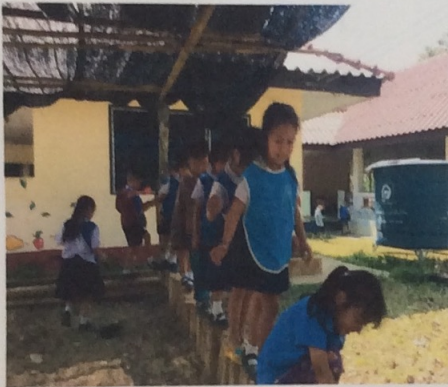
เดินต่อเท้าไปข้างหน้า