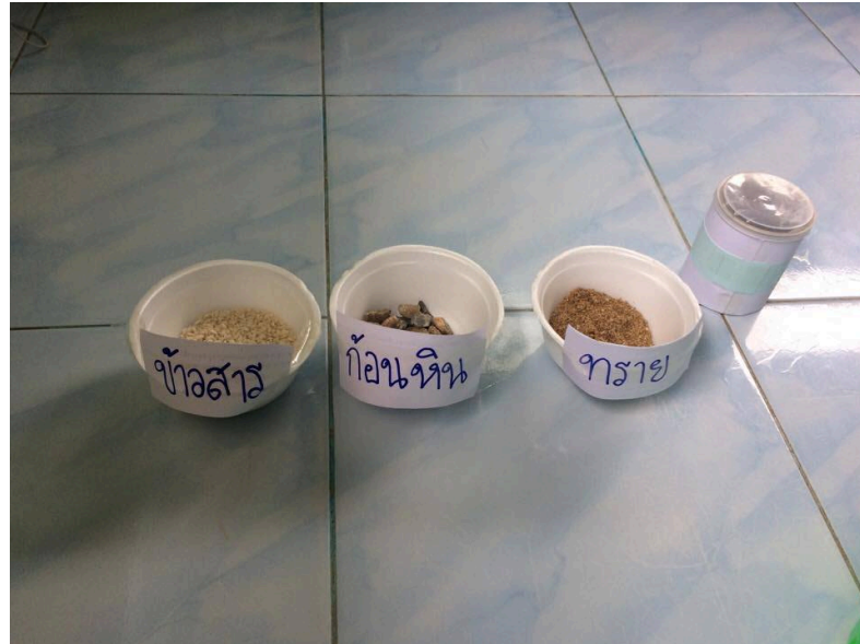
ภาพประกอบ