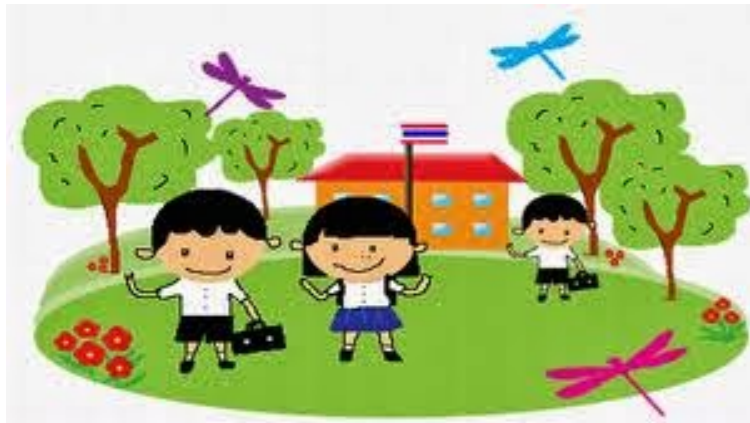
ภาพประกอบ