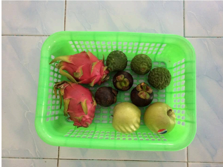
ภาพประกอบ

ข้อที่ 4 ใช้เวลา 1-2 นาที สถานการณ์: ให้เด็กบอกชื่อผลไม้ วัสดุ-อุปกรณ์ 1.ผลไม้ต่างชนิด,มะกรูด 2.ตะกร้า