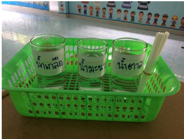
ภาพประกอบ