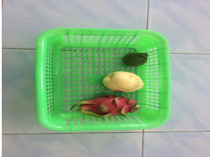
ภาพประกอบ