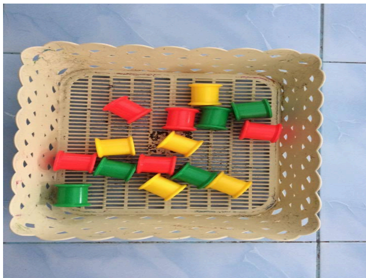
ภาพประกอบ