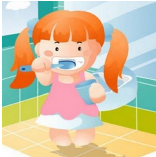
ภาพประกอบ