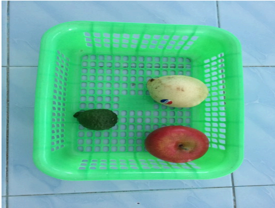
ภาพประกอบ