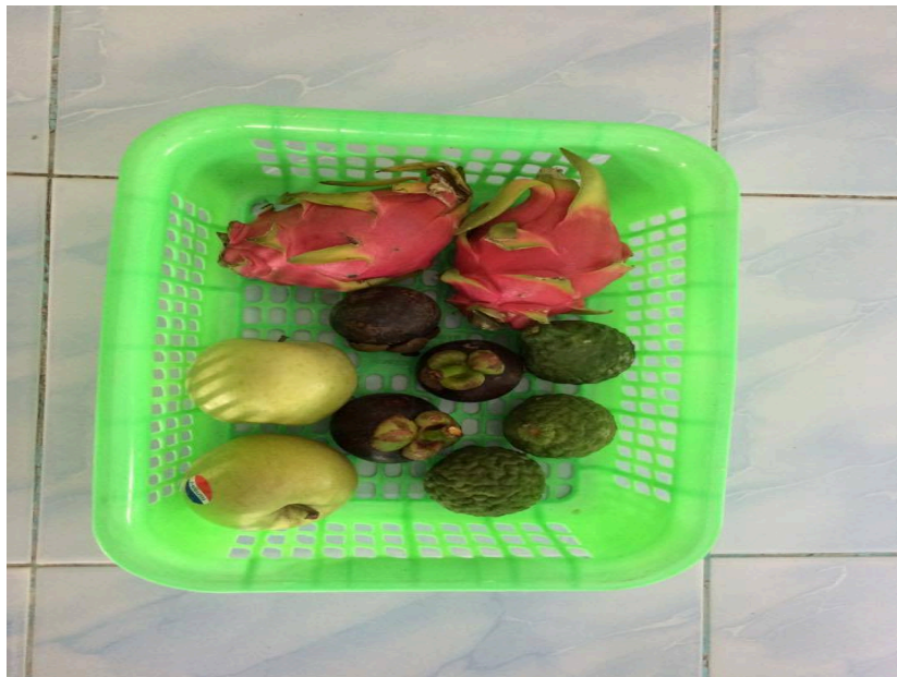
ภาพประกอบ