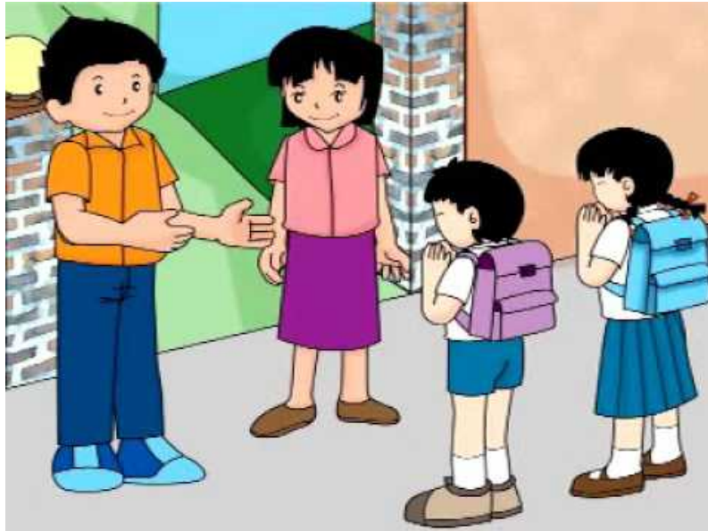
ภาพประกอบ