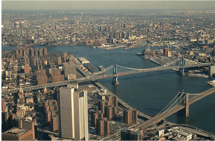
รูปที่ 4-2 การขยายตัวของเมือง

เจ้าของ ไม่มีแหล่งธุรกิจการค้า ซึ่งถือว่าเป็นศูนย์กลางของเมือง หรือ Downtown เห็นได้ชัดเจน แต่อยู่กระจัดกระจายในย่านต่าง ๆ ทั่วไป แบบอย่างการตัดถนนเป็นไปโดยความบังเอิญไม่ได้มีการวางแผนตามหลักวิชาผังเมืองแต่อย่างใด การขยายเขตเมืองออกไปเป็นไปโดยไม่คำนึงถึงการใช้ประโยชน์จากพื้นที่ดินอย่างเต็มที่