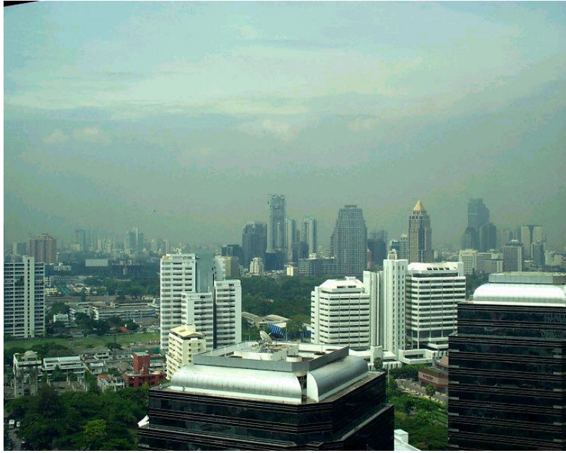
รูปที่ 4-1 แสดงลักษณะการขยายตัวของเมืองในกรุงเทพมหานคร