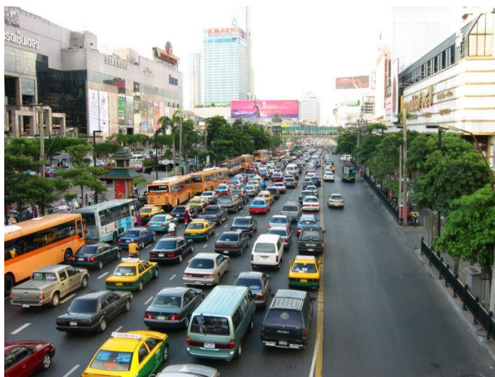
รูปที่ 4-4 สภาพปัญหาการจราจรติดขัดในกรุงเทพมหานคร

ปัญหาของการจราจรจะก่อให้เกิดปัญหาอากาศเป็นพิษเมื่อจำนวนรถยนต์ที่เคลื่อนไปในทิศทางเดียวกัน มีมากกว่า 2,500 คันต่อชั่วโมง (หรือ 208 คัน ต่อ 5 วินาที) จากการวิจัยพบว่าในบางจุดจำนวนรถยนต์ที่เคลื่อนไปในทิศทางเดียวกัน มีมากกว่า 208 คัน ต่อ 5 วินาที ดังนั้น การควบคุมสภาพอากาศเสียในกรุงเทพมหานคร สามารถทำได้โดยการลดจำนวนรถยนต์ในถนนให้ลดน้อยลง