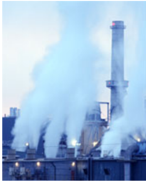
รูปที่ 4-5 มลพิษทางอากาศที่เกิดจาก โรงงานอุตสาหกรรม

กรุงเทพมหานครมีโรงงานอุตสาหกรรมหลายประเภท ซึ่งอุตสาหกรรมบางประเภทอาจจะมีผลต่อสุขภาพของประชาชน ดังนั้น รัฐบาลควรมีกฎหมายที่กำหนดระดับที่เป็นอันตราย เนื่องจากควัน ฝุ่น หรือน้ำเสียควรให้โรงงานนั้นจัดตั้งระบบกำจัดของเสียเหล่านี้ให้อยู่ในระดับที่ปลอดภัยก่อนที่จะปล่อยออกไปจากโรงงาน