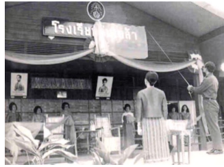
ภาพที่ 1.9 พระบาทสมเด็จพระเจ้าอยู่หัวพระราชทานพระราชทรัพย์ส่วนพระองค์สนับสนุน การก่อสร้าง โรงเรียน และจัดซื้ออุปกรณ์ต่างๆ พร้อมทั้งพระราชทานนามว่า โรงเรียนร่มเกล้า

2. พระบาทสมเด็จพระเจ้าอยู่หัวมีพระราชดำริให้ทหารช่วยก่อสร้าง โรงเรียนเพื่อให้ทหารมี ส่วนช่วยเหลือประชาชนด้านการศึกษา โดยให้แม่ทัพภาคเป็นแกนนำในการก่อสร้าง โรงเรียน ในเขตพื้นที่ ที่รับผิดชอบและพระราชทานพระราชทรัพย์ส่วนพระองค์ สนับสนุนการก่อสร้าง โรงเรียน โดยจัดตั้ง โรงเรียนขึ้น