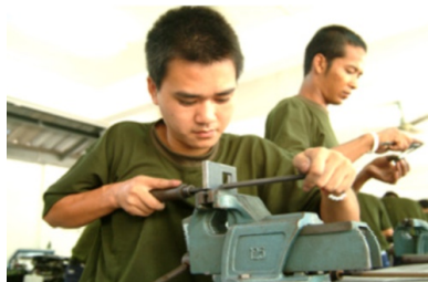
ภาพที่ 1.13 โรงเรียนพระดาบส เกิดขึ้นตามพระราชดำริที่ต้องการให้การศึกษาแก่ประชาชนในลักษณะเดียวกับสมัยโบราณที่ผู้เรียนต้องไปหาพระอาจารย์แล้วฝากตัวเป็นศิษย์โดยใช้สถานที่ของพระราชวัง

7. โรงเรียนพระดาบส เกิดขึ้นตามพระราชดำริที่ต้องการให้การศึกษาแก่ประชาชนในลักษณะเดียวกับสมัยโบราณที่ผู้เรียนต้องไปหาพระอาจารย์แล้วฝากตัวเป็นศิษย์โดยใช้สถานที่ของพระราชวัง