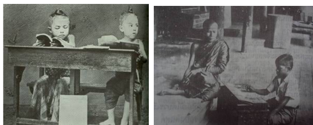
ภาพที่ 1.1 การศึกษาไทยสมัยโบราณ

4. การศึกษาในบ้านเป็นการจัดการศึกษาสำหรับกุลบุตรกุลธิดาตามบ้านขุนนางหรือคหบดี ครูผู้สอนคือ ผู้อาวุโสในบ้านหรือผู้ที่มีความสามารถที่ขุนนางหรือคหบดีจ้างมาสอนบุตรหลานวิชาที่สอน คือ การอ่านการเขียนหนังสือภาษาไทยและอาชีพหลักของครอบครัวนั้นๆ เช่น ช่างทอง ช่างเหล็ก