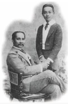
ภาพที่ 1.6 การปฏิรูปการศึกษาในรัชสมัยพระบาทสมเด็จพระจุลจอมเกล้าเจ้าอยู่หัว และในรัชสมัยพระบาทสมเด็จพระมงกุฎเกล้าเจ้าอยู่หัวซึ่งเป็นรากฐานของการศึกษาไทยในปัจจุบัน

สมัยรัชกาลที่ 5 ในรัชสมัยพระบาทสมเด็จพระจุลจอมเกล้าเจ้าอยู่หัว ประเทศมี ความเจริญรุ่งเรืองในทุกๆ ด้านทั้งด้านการปกครองการศาลการคมนาคมและการสาธารณสุข โดยเฉพาะ ด้านการศึกษา พระองค์ท่านทรงเห็นว่าการศึกษาคือรากฐานของการพัฒนาประเทศ จึงทรงสนับสนุน การศึกษาอย่างจริงจัง ซึ่งนับได้ว่าเป็นครั้งแรกของการปฏิรูปการศึกษา การศึกษาไทยในสมัยนี้จึงเปลี่ยนรูป จากแบบไม่เป็นทางการ ไม่มีระเบียบแบบแผนเป็นการศึกษาที่มีระบบ มีระเบียบแบบแผน (Formal education)มีการจัดทำโครงการศึกษาชาติ มีการกำหนดวิชาเรียนมีการจัดการเรียนการสอน ในชั้นเรียน การสอบไล่และจัดให้มีทุนเล่าเรียนหลวงเพื่อให้ราษฎรได้รับ โอกาสในการศึกษาหาความรู้ในสาขาวิชา ที่ประเทศมีความต้องการผู้ที่มีความเชี่ยวชาญโดยทุนดังกล่าวเป็นทุนที่ใ้ราษฎรไปศึกษาเล่าเรียน ที่ต่างประเทศ