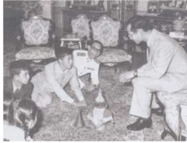
ภาพที่ 1.8 พระบาทสมเด็จพระเจ้าอยู่หัว ทรงพระกรุณา โปรดเกล้า โปรดกระหม่อม พระราชทานพระราชทรัพย์ส่วนพระองค์เพื่อก่อตั้งกองทุนการศึกษา

1. พระบาทสมเด็จพระเจ้าอยู่หัว ทรงพระกรุณาโปรดเกล้าโปรดกระหม่อมพระราชทาน พระราชทรัพย์ส่วนพระองค์เพื่อก่อตั้งกองทุนการศึกษาชั้นหลายทุนตั้งแต่ระดับประถมศึกษา มัธยมศึกษา และอุดมศึกษา เช่น มูลนิธิอานันทมหิดลเป็นทุนสำหรับการศึกษาในแขนงวิชาต่างๆ เพื่อสนับสนุนให้ ประชาชนได้มีโอกาสศึกษาวิชาความรู้ในชั้นสูง