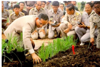
ภาพที่ 1.12 ศูนย์การศึกษาพัฒนาเขาหินซ้อน อันเนื่องมาจากพระราชดำริ จังหวัดฉะเชิงเทรา

6. ศูนย์การศึกษาการพัฒนาอันเนื่องมาจากพระราชดำริ เป็นศูนย์การศึกษาค้นคว้าทดลองวิจัยและแสวงหาแนวทาง และวิธีการพัฒนาต่างๆ ปัจจุบันศูนย์ศึกษาพัฒนาอันเนื่องมาจากพระราชดำริมีอยู่ทั้งหมด 6 ศูนย์