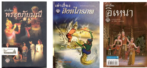
ภาพที่ 1.4 ผลงานที่ทรงคุณค่าของสุนทรภู่ กวีในรัชกาลที่ 2 ที่ได้รับการยกย่องจากองค์การยูเนสโกให้เป็นบุคคลสำคัญของ โลกด้านงานวรรณกรรม

สมัยรัชกาลที่ 2 พระพุทธเลิศหล้านภาลัย ช่วงนี้ประเทศเริ่มมีสัมพันธไมตรีและการค้ากับ ชาวต่างชาติอีกครั้ง เช่น โปรตุเกส อังกฤษ ฝรั่งเศส ฮอลันดา เป็นต้น เนื่องจากประเทศทางยุโรป มีการปฏิวัติ อุตสาหกรรมทำให้สามารถผลิตสินค้าได้เป็นจำนวนมากจากเครื่องจักรที่ใช้พลังงานจาก ไอน้ำ ประเทศต่างๆ ทางยุโรป เหล่านี้ จึงต้องการติดต่อค้าขายกับประเทศทางเอเชียเพื่อต้องการขายสินค้า การติดต่อสื่อสารเพื่อ การค้าขาย นี้เองทำให้คนไทยมีความทันสมัยและมีวิทยาการต่างๆจากตะวันตกผสมผสาน การศึกษา ของไทยจึงเริ่ม เปลี่ยนแปลงไปอีกครั้งหนึ่ง