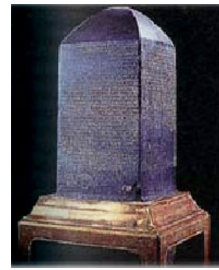
ภาพที่ 1.2 พ่อขุนรามคำแหงมหาราชและหลักศิลาจารึก

สมัยกรุงศรีอยุธยา กรุงศรีอยุธยาเป็นราชธานีมายาวนานรวมเวลาทั้งสิ้น 417 ปี มีความเจริญทั้งทางด้านสังคม การเมืองและเศรษฐกิจ ความเจริญดังกล่าวเกิดมาจากการติดต่อค้าขายกับชาวต่างชาติ เช่น จีน มอญ ญวน เขมรอินเดียนและอาหรับ ในรัชสมัยพระรามาธิบดีที่ 2 ได้เริ่มติดต่อค้าขายกับชาวตะวันตกเช่น โปรตุเกส ฮอลันดา ฝรั่งเศส อังกฤษและจากการติดต่อค้าขายกับชาวตะวันตกนี้เอง