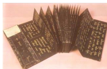
ภาพที่ 1.3 การจัดการศึกษาสมัย โบราณ