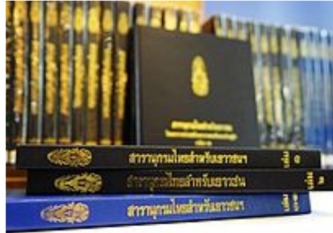
ภาพที่ 1.14 สารานุกรมไทยสำหรับเยาวชน

8. พระบาทสมเด็จพระเจ้าอยู่หัวฯ โปรดเกล้าฯ ให้วิทยากรทรงคุณวุฒิในแต่ละสาขาวิชา ร่วมจัดทำสารานุกรมไทยสำหรับเยาวชน โดยแบ่งเนื้อหาออกเป็นสามระดับ เพื่อให้เยาวชนสามารถค้นคว้าความรู้ หัดตามพื้นฐานความรู้เดิม ประกอบด้วย 7 สาขาวิชา วิทยาศาสตร์ เทคโนโลยี สังคมศาสตร์ มนุษย์ศาสตร์ เกษตรศาสตร์ แพทย์ศาสตร์ และคณิตศาสตร์