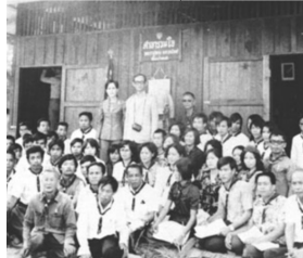
ภาพที่ 1.11 พระบาทสมเด็จพระเจ้าอยู่หัวทรงริเริ่มตั้งศาลาร่วมใจตามหมู่บ้านในชุมชนเพื่อให้ประชาชนได้ใช้เป็นห้องสมุดประชาชน

5. พระบาทสมเด็จพระเจ้าอยู่หัวทรงเห็นความสำคัญของการศึกษานอกระบบ โรงเรียนสภสำหรับประชาชนที่อยู่ในชนบท ทรงริเริ่มศาลาร่วมใจตามหมู่บ้านชนบทเพื่อให้ประชาชนได้ใช้เป็นห้องสมุดประชาชน