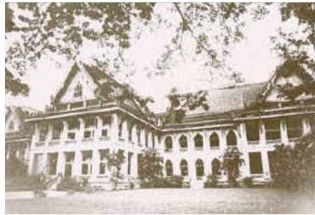
ภาพที่ 1.7 พระบาทสมเด็จพระจุลจอมเกล้าเจ้าอยู่หัวและพระบาทสมเด็จพระมงกุฎเกล้าเจ้าอยู่หัว ทรงโปรดเกล้าฯ ให้จัดตั้งจุฬาลงกรณ์มหาวิทยาลัย มหาวิทยาลัยแห่งแรกของประเทศไทย

4. มหาวิทยาลัยแห่งแรกของประเทศไทย เริ่มต้นจากพระบาทสมเด็จพระจุลจอมเกล้าเจ้าอยู่หัวฯ ได้ทรงเล็งเห็นความสำคัญของการศึกษา ทรงโปรดฯ ให้มีการตั้งโรงเรียนพระตำหนักสวนกุหลาบ เป็นโรงเรียนนายทหารมหาดเล็ก ต่อมาได้เปลี่ยนเป็นโรงเรียนข้าราชการพลเรือนเพื่อฝึกคนเข้ารับราชการตาม กระทรวง ทบวง กรมต่างๆ ซึ่งต่อมาภายหลังพระบาทสมเด็จพระมงกุฎเกล้าเจ้าอยู่หัวฯ