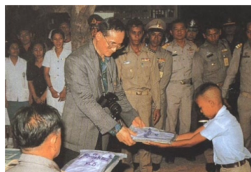
ภาพที่ 1.10 พระบาทสมเด็จพระเจ้าอยู่หัวทรงช่วยเหลือนักเรียนที่ขาดแคลนทุนทรัพย์

3. พระบาทสมเด็จพระเจ้าอยู่หัว ทรงพระกรุณาโปรดเกล้าฯ พระราชทานพระราชทรัพย์ส่วนพระองค์เป็นทุนริเริ่ม ในการก่อสร้าง โรงเรียนตามวัด ในชนบทเพื่อสงเคราะห์เด็กยากจนและกำพร้าให้ได้มี สถานที่สำหรับศึกษาเล่าเรียน ทรงก่อดังกองทุนนวกฤษในมูลนิธิช่วยนักเรียนที่ขาดแคลน ในพระบรมราชูปถัมภ์ เพื่อช่วยให้นักเรียนที่ขาดแคลนทุนทรัพย์ได้มีโอกาสเข้ารับการศึกษาระดับประถมศึกษาและระดับมัธยมศึกษา โดยอาราธนาพระภิกษุเป็นครูสอนในวิชาสามัญและอบรมศีลธรรมแก่นักเรียน โดยมี พระราชประสงค์ที่จะให้นักเรียนมีความใกล้ชิดศาสนาซึ่งจะทำให้เยาวชนของชาติเป็นผู้มีความรู้ด้านวิชาการ และมีจิตใจตั้งมั่นอยู่ในศีลธรรมเพื่อที่จะได้เป็นพลเมืองที่ดีของประเทศ