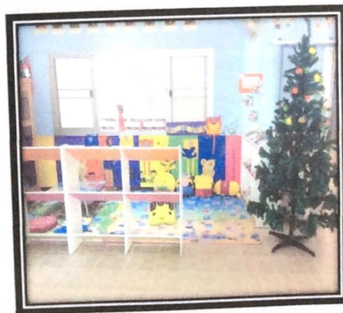
ภาพห้องสมุดมีชีวิต