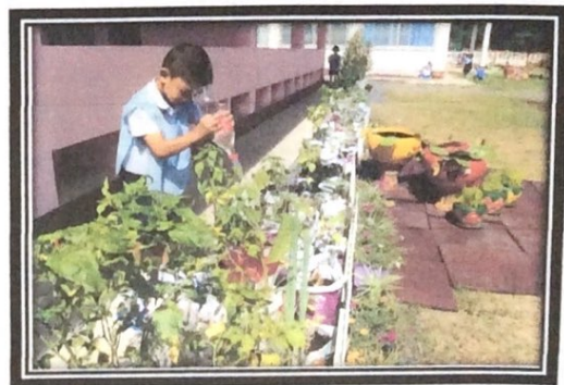
เด็กรดน้ำต้นไม้ของตนเองในรั้วผักสวนครัว