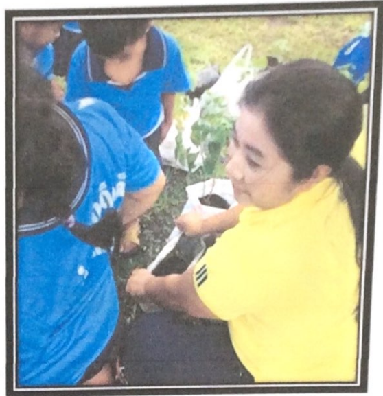
เด็กและครูร่วมกันปลูกต้นไม้ในกระสอบเหลือใช้