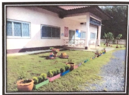
สำเร็จตามเป้าหมายศูนย์สวยด้วยมือหนู