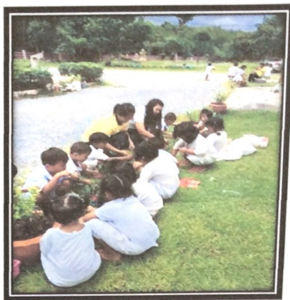
จัดเตรียมวัสดุอุปกรณ์โดยเด็กและครูร่วมกันปลูกต้นไม้ประดับ