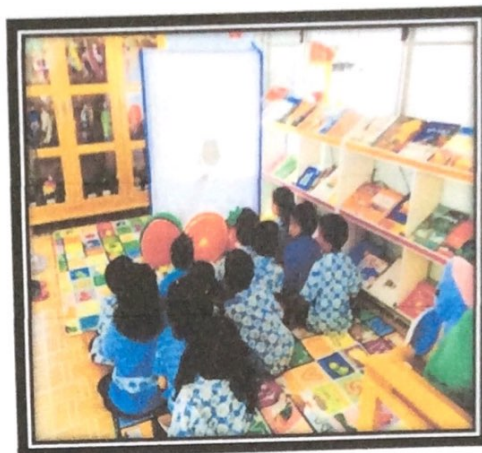
ภาพห้องสมุดก่อนจัดโครงการ