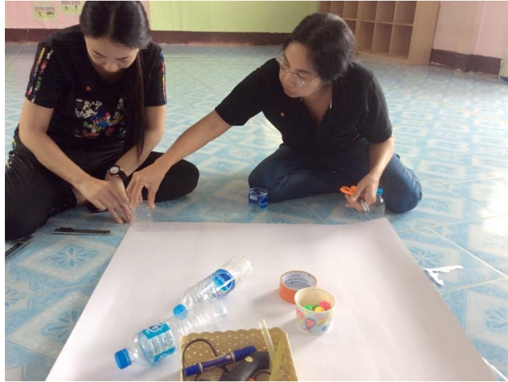
3. นำมาวัดกับกระดาษแข็งเพื่อใส่ในขวด