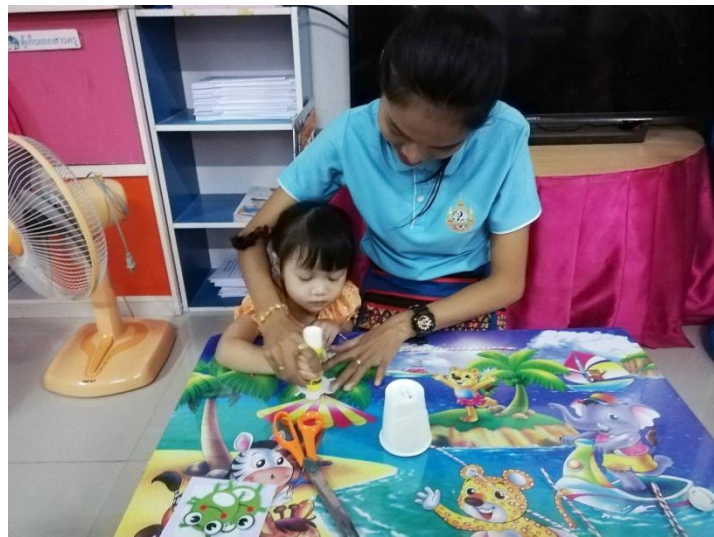
6. นำรูปกบที่เตรียมไว้ มาทากาวเพื่อติดที่แก้วหรือถ้วยไอติม