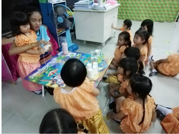
5. นำเชือกที่ผูกกับหลอดมาร้อยเข้ารูตรงกันแก้วที่เจาะเตรียมไว้