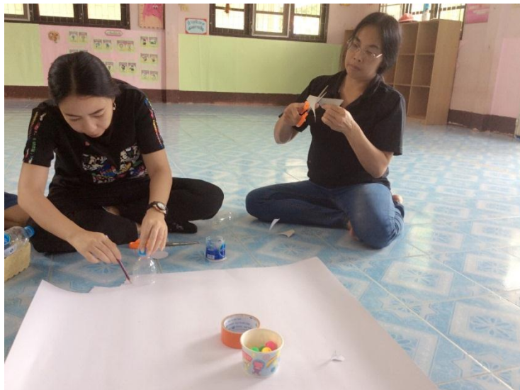
4. ตัดกระดาษตามที่วัดไว้ พร้อมกับเจาะรูเพื่อให้ลูกบิดหรือลูกแก้วกลิ้งลงได้