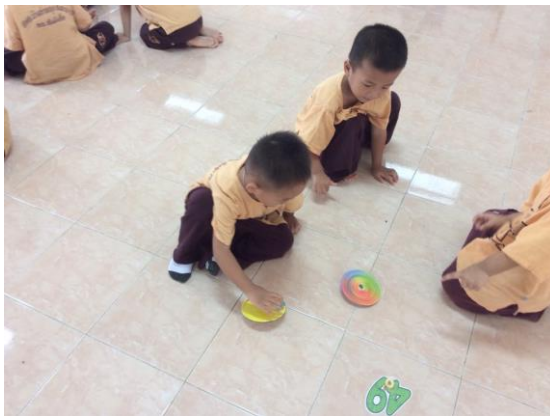
ลูกข้างหลากสี เรียนรู้เรื่องสี