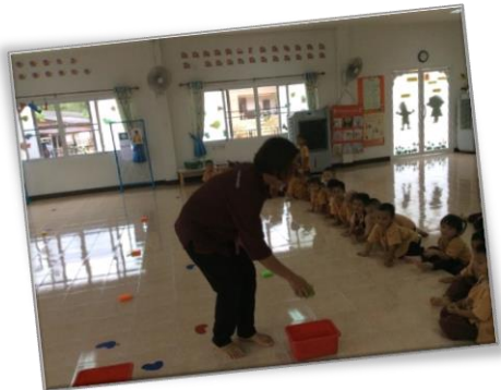
สาธิตวิธีการเล่นเกม