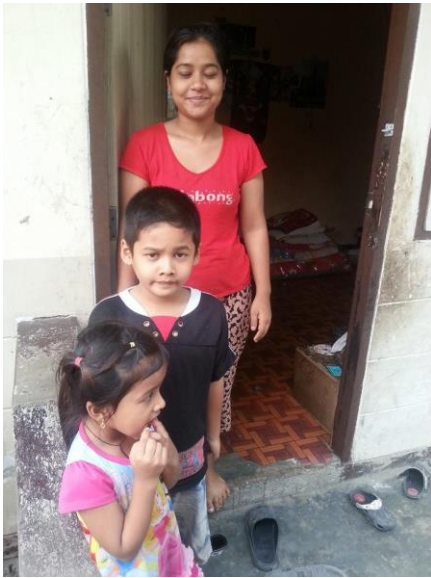
โครงการเยี่ยมบ้าน