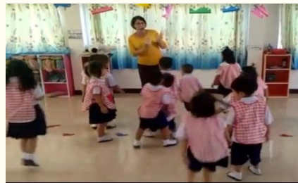
ขั้นตอนการทำกิจกรรม