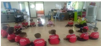
เด็กดูบัตรภาพขั้นตอนการล้างมือ 7 ขั้นตอน และครูสาธิตวิธีการล้างมือให้เด็กดูทีละขั้นตอน