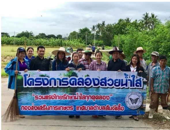
คลองสวยน้ำใส