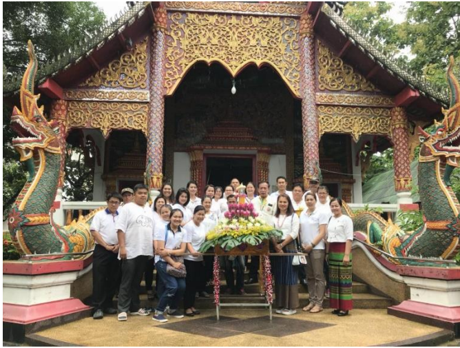
ถวายเทียนพรรษาตามวัดต่างๆ ในเขตตำบลสันผีเสื้อ ร่วมกับผู้บริหาร และประชาชน