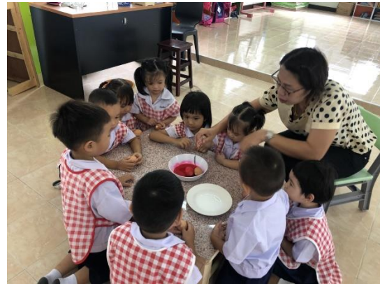
ไข่นกอินทรี เรียนรู้เรื่องสี