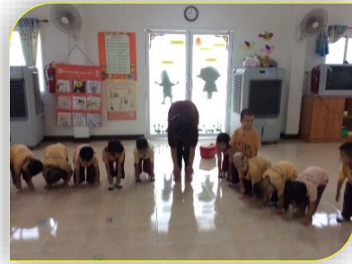
ออกกำลังกายกันหนอยก่อนเล่นเกม