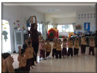
ยืดเหยียดร่างกายหลังเล่นเกม