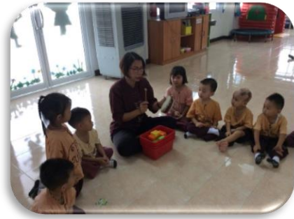
แนะนำอุปกรณ์การเล่น