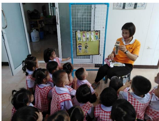
การจัดกิจกรรมตามแผนการจัดประสบการณ์