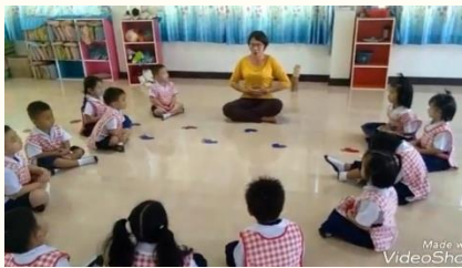
ทำท่าทางประกอบเพลง ดอกไม้บาน