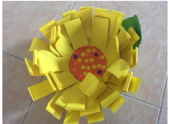
ลูกช่างหลากสี