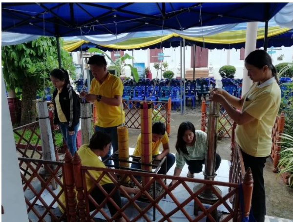
จัดเตรียมสถานที่หล่อเทียนพรรษา