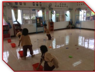
เด็กเล่นเกม “วิ่งเก็บของ”