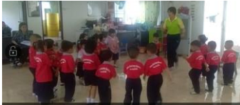
การเคลื่อนไหวร่างกายประกอบเพลง