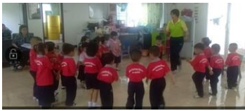
การเคลื่อนไหวร่างกายประกอบเพลง