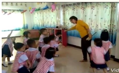
อธิบายการปฏิบัติกิจกรรม