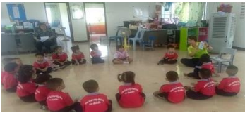
เด็กดูบัตรภาพขั้นตอนการล้างมือ 7 ขั้นตอน และครูสาธิตวิธีการล้างมือให้เด็กดูทีละขั้นตอน