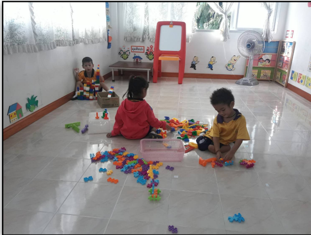
เล่นตามความสนใจของเด็ก