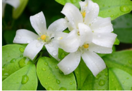
ดอกพิกุล