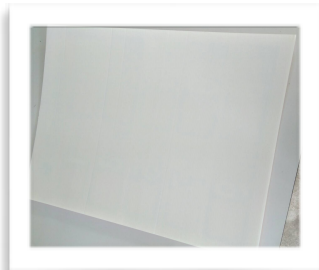
ฟิวเจอร์บอร์ด