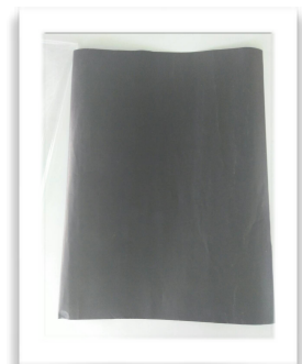
กระดาษสีดำ