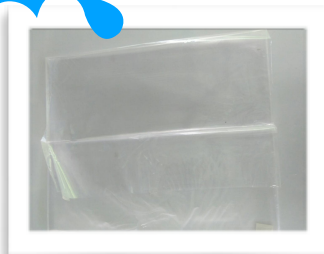
พลาสติกใส