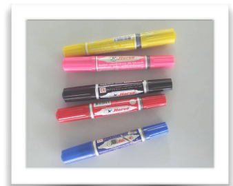
ปากกาเคมี