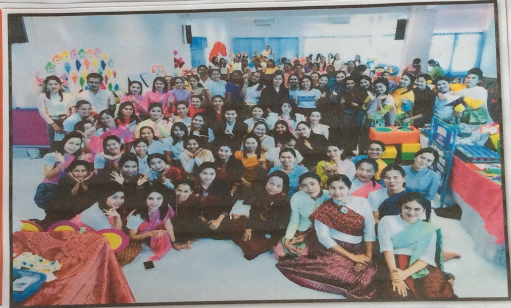
ภาพการเข้าร่วมกิจกรรม

สรุปสาระที่ได้จากการปฐมนิเทศ ตามที่ขอไปดำเนินการปฐมนิเทศ การสอนในสถานศึกษา การปฏิบัติสอน การคิดประสบการณ์ แผนการเรียนรู้ และ การมีหน้าที่ การคิดประสบการณ์ การนำร่องสอน และ การสอนในสถานศึกษา เพื่อจัดทำโครงการพัฒนาการเรียน การสอน และ การประเมินผล จากสถานศึกษา และการจัดการเรียน และ การประเมินผล การปฏิบัติการสอนในสถานศึกษา