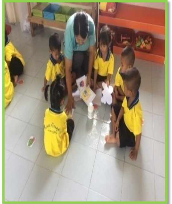
ประกอบเป็นการ์ดป๊อปอัพให้สวย