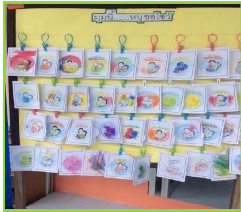
ไหว้ผลงาน