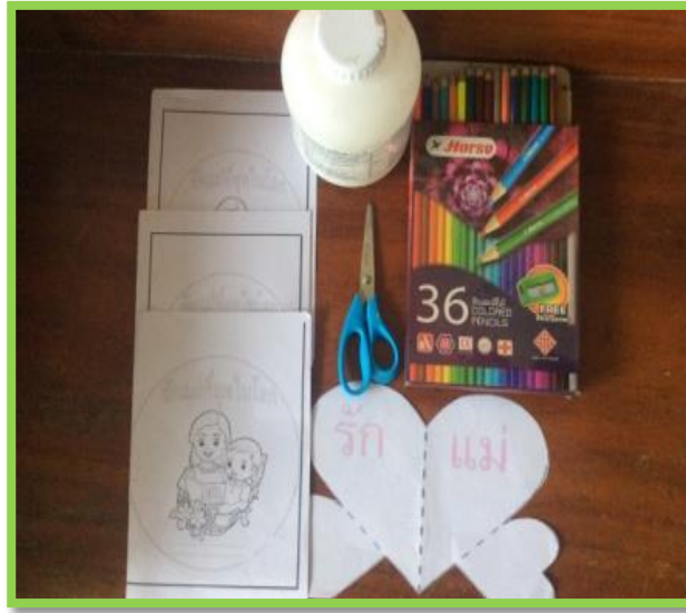
อุปกรณ์ในการผลิตสื่อ