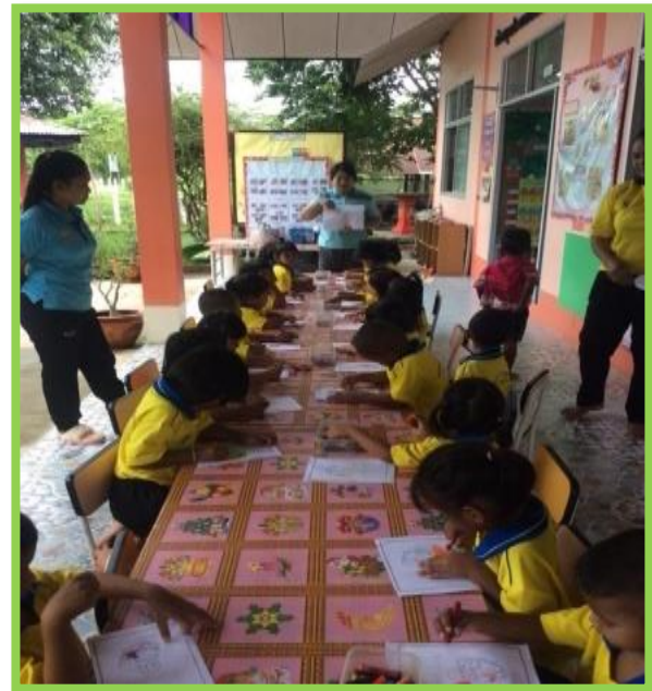
ระบายสีให้สวยงามนะคะ