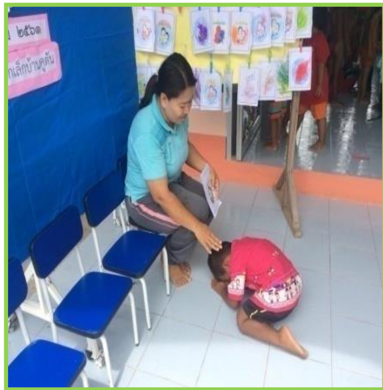
นำการ์ดไปไหว้คุณแม่เนื่องในวันแม่