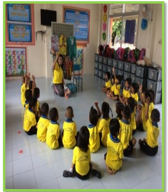
จัดกิจกรรมส่งเสริมการเรียนรู้ และได้ลงมือปฏิบัติจริง