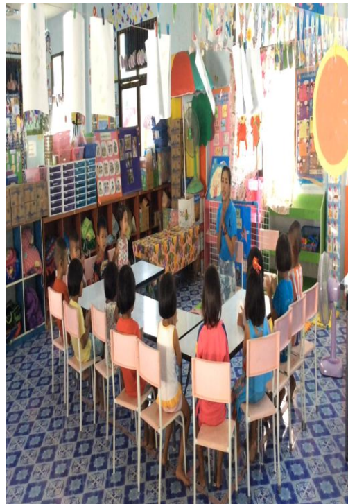
เด็กและครูร่วมกันสรุปส่วนประกอบของบ้าน