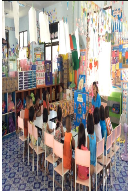
เด็กและครูร่วมกันสนทนาส่วนประกอบของบ้าน ครูขออาสาสมัครบอกชื่อส่วนประกอบของบ้าน