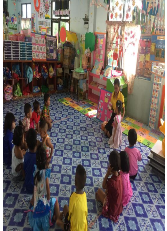
เด็กและครูสนทนาเกี่ยวกับการอาบน้ำ อาสาสมัครมาเล่าการอาบน้ำ การใช้อุปกรณ์ในการอาบน้ำ เด็กและครูร่วมกันสรุปเรื่องอุปกรณ์การอาบน้ำ การอาบน้ำที่ถูกต้อง