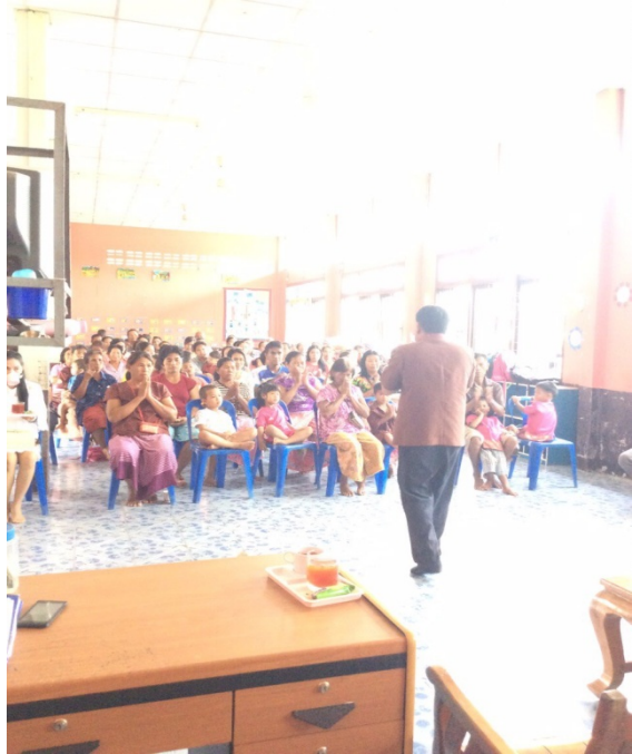
สถานที่ดำเนินโครงการ ศพด.บ้านหนองเสม็ด ต.ไทยสามัคคี อ.หนองหงส์ จังหวัดบุรีรัมย์