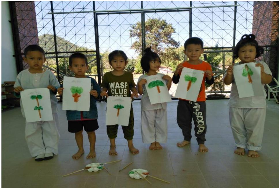
ภาพกิจกรรมสร้างสรรค์ การพิมพ์ภาพจากใบไม้