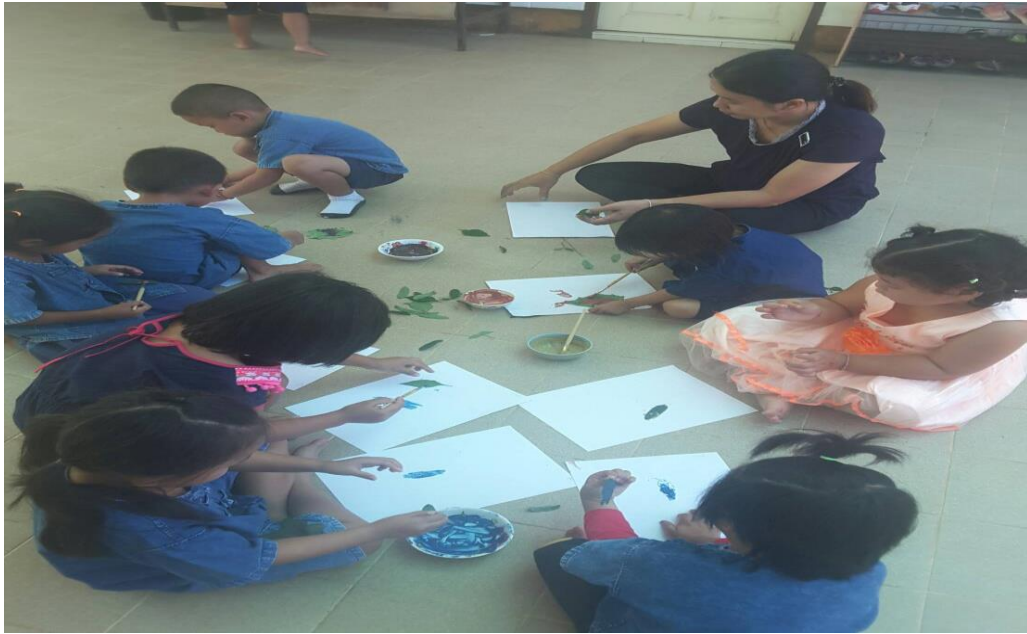
ภาพกิจกรรมสร้างสรรค์ การฉีกปะรูปต้นไม้