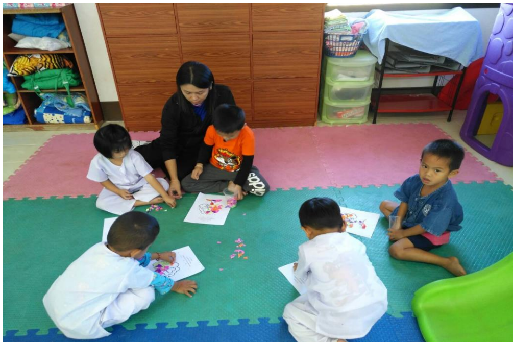
ภาพกิจกรรมสร้างสรรค์