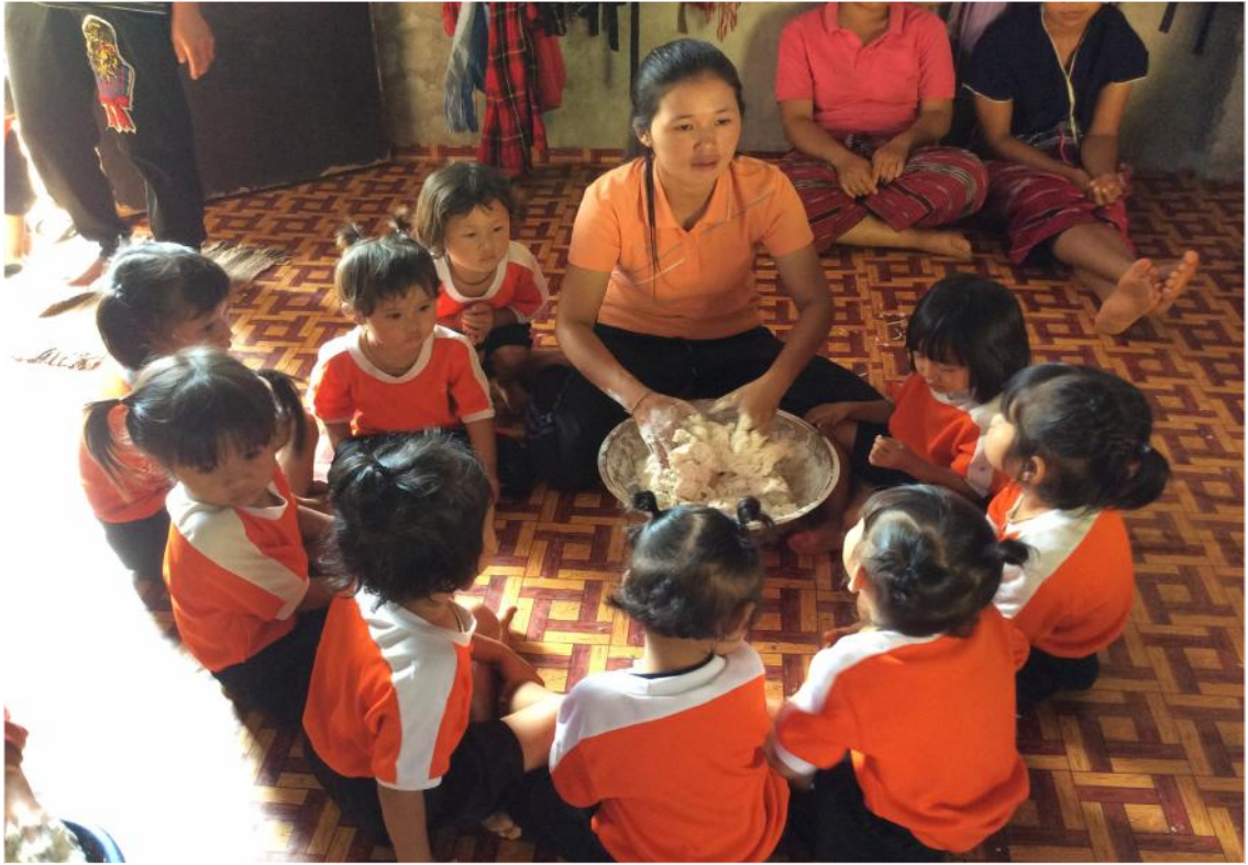
ครูและผู้ปกครองเด็กกำลังสาธิตวิธีการนวดแป้งให้เด็กๆก่อบั๊วให้เด็กลงมือปฏิบัติค่ะ