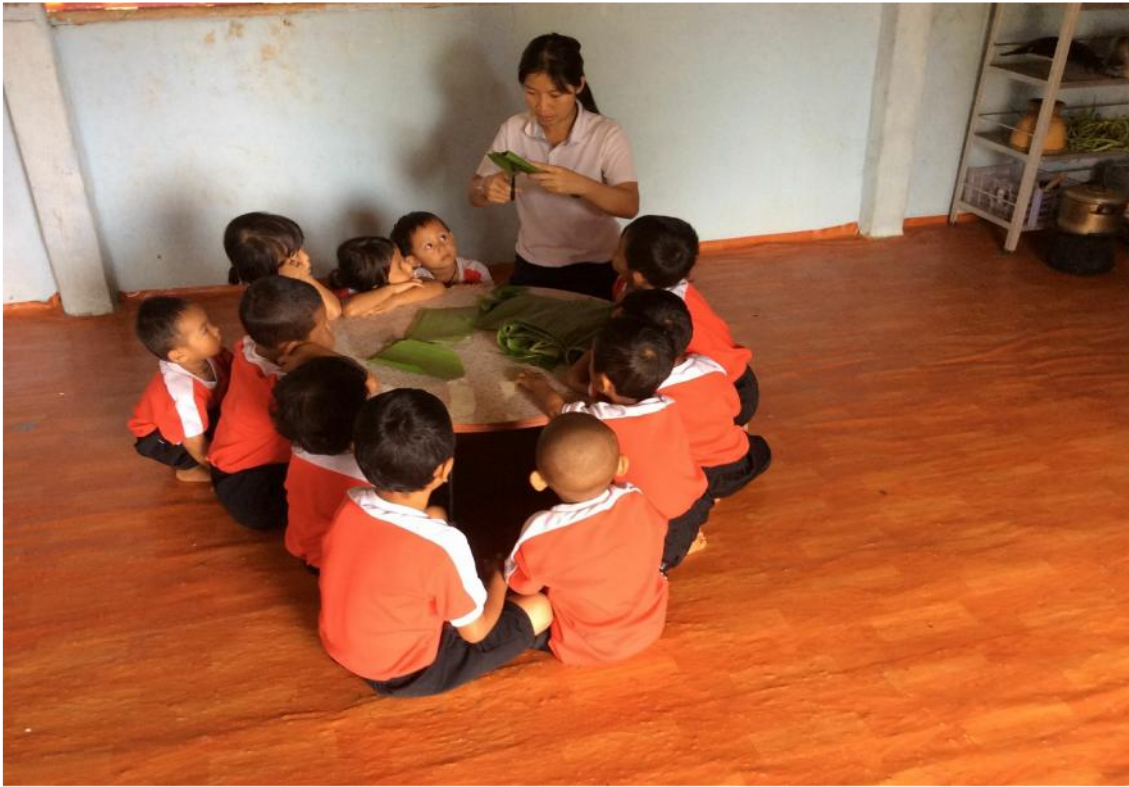
ครูกำลังสอนเด็กตัดใบกล้วยที่จะห่อขนมจ็อก