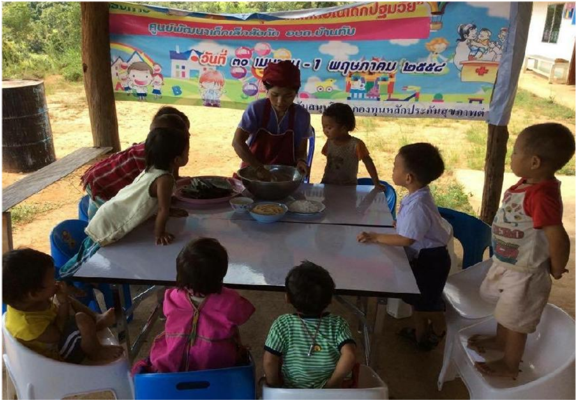
ครูและเด็กๆกำลังลงมือขนาดแป้งกันแล้วค่ะ