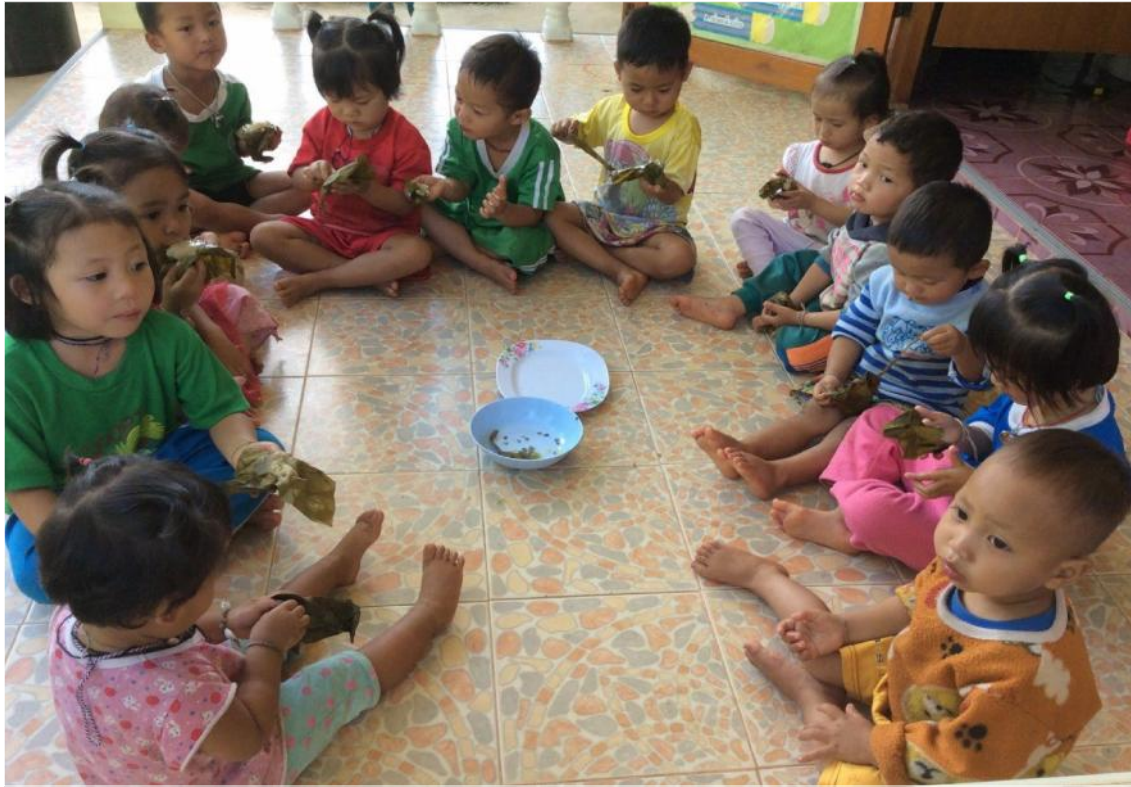
หนูๆได้กินขนมจ็อกแสนอร่อย