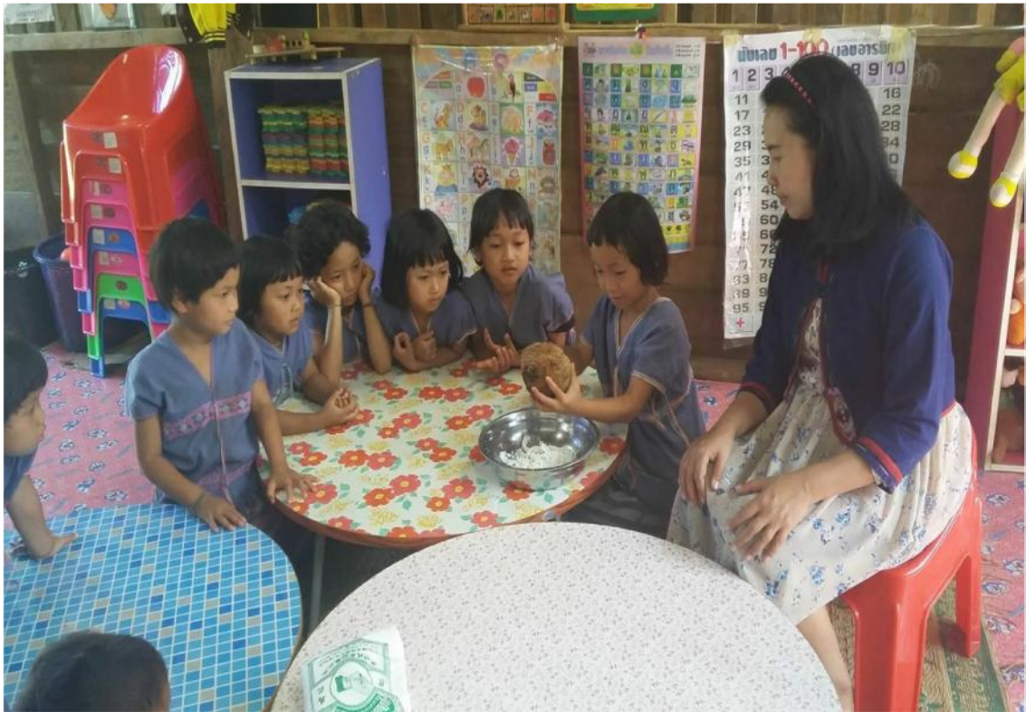
เด็กช่วยครูทำไส้ขนมจ็อก