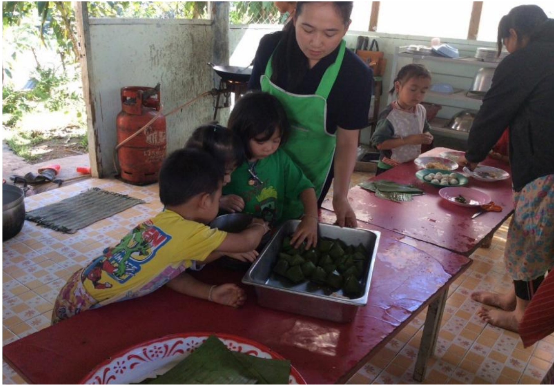
ห่อขนมจ็อกเสร็จแล้วพร้อมนำมานึ่ง