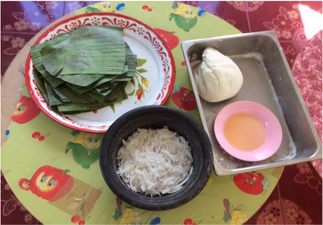
เด็กๆ นวดแป้งเสร็จพร้อมที่จะห่อขนมจ๊อก