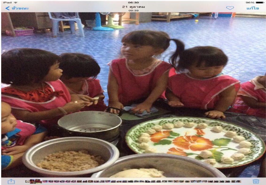
ครูและแม่ครัวกำลังสาธิตให้ได้ลงมือปฏิบัติค่ะ