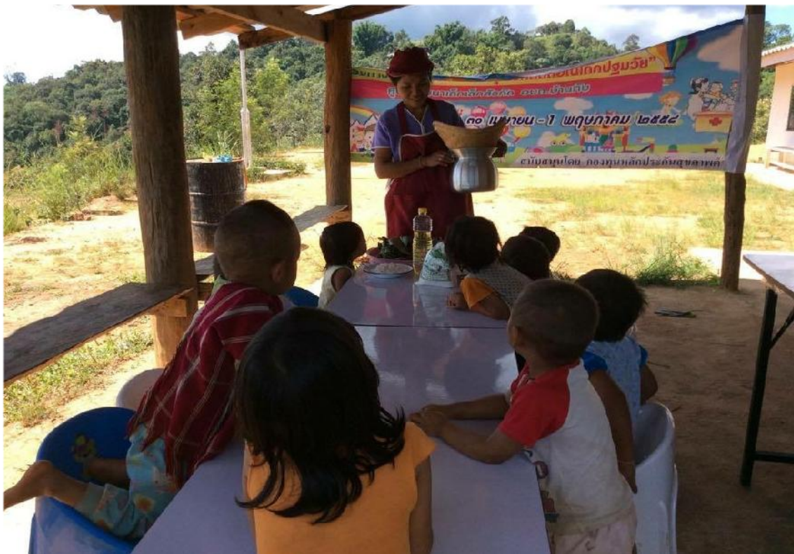
หลังจากห่อขนมจ็อกเสร็จแล้วครูก็นำไปนั่งจบนสุกและก็ได้ออกมาเป็นขนมจ็อกแสนอร่อยของหนูๆคะ