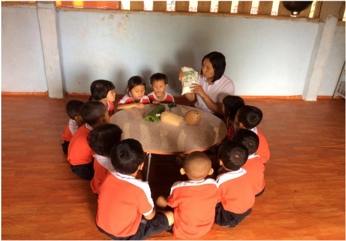
เด็กๆกำลังเรียนรู้ส่วนประกอบของขนมจี๊อก