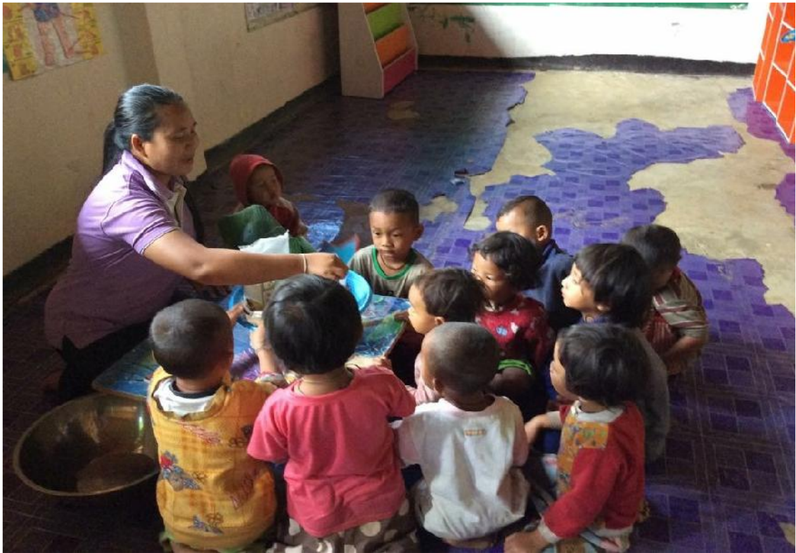
หนูห่อขนมจ็อกเสร็จพร้อมรับประทาน