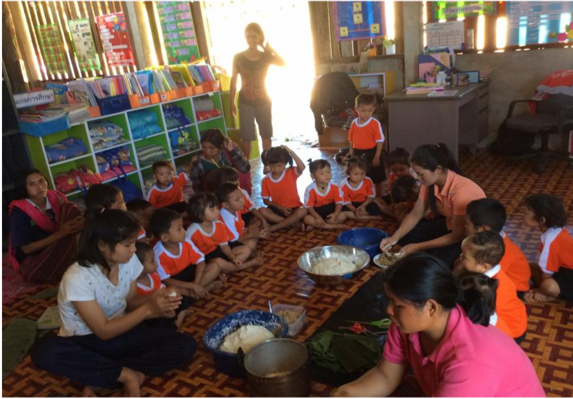
ผู้ปกครองและครูรวมทั้งเด็กๆกำลังลงมือปฏิบัติกันแล้วค่ะ