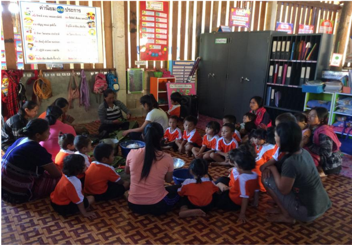
ผู้ปกครองและเด็กๆทำกิจกรรมร่วมกันอย่างมีความสุข