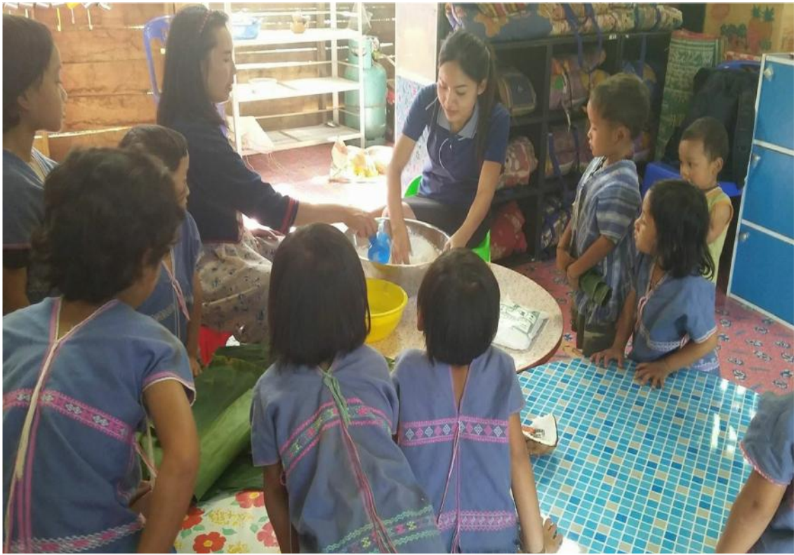
ครูและเด็กกำลังห่อขนมจี๊อก