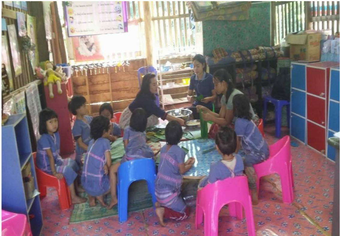
ครูและเด็กกำลังทำขนมจ็อก