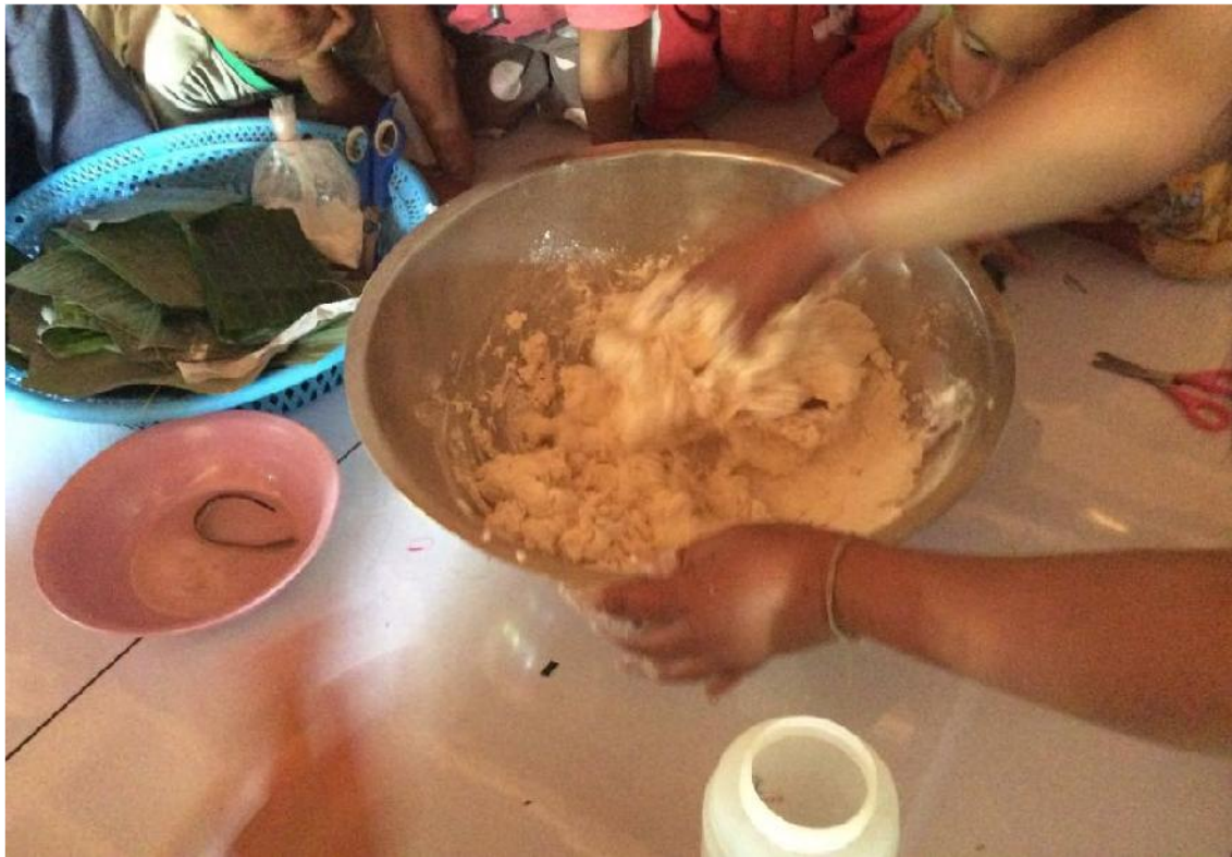
ครูเริ่มลงมือนวดแป้ง