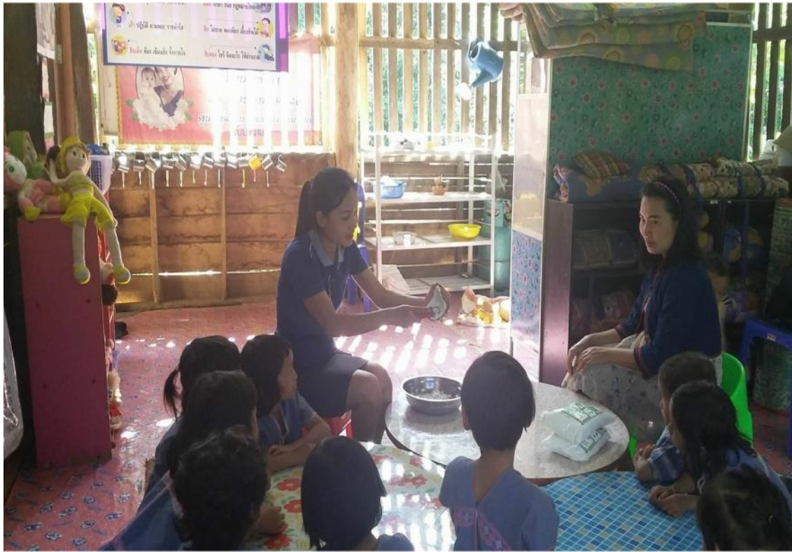
เด็กตั้งใจมาทำขนมจ็อกกับครูพร้อมเอาใบกล้วยมาจากบ้านเอง