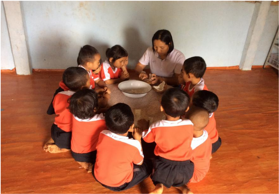
ครูและเด็กกำลังชုดใส่ขนมค่ะ