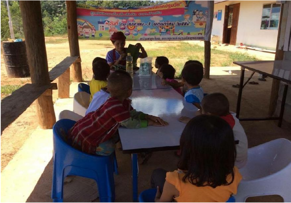
ครูกำลังแนะนำวัสดุอุปกรณ์และส่วนผสมของขนมค่ะ