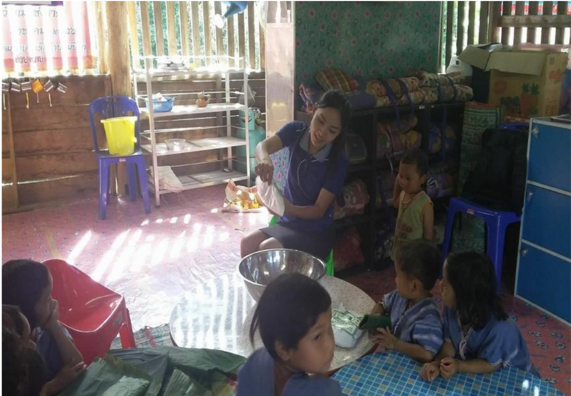
เด็กช่วยครูทำไส้ขนมจ็อกพร้อมทั้งนวดแป้ง