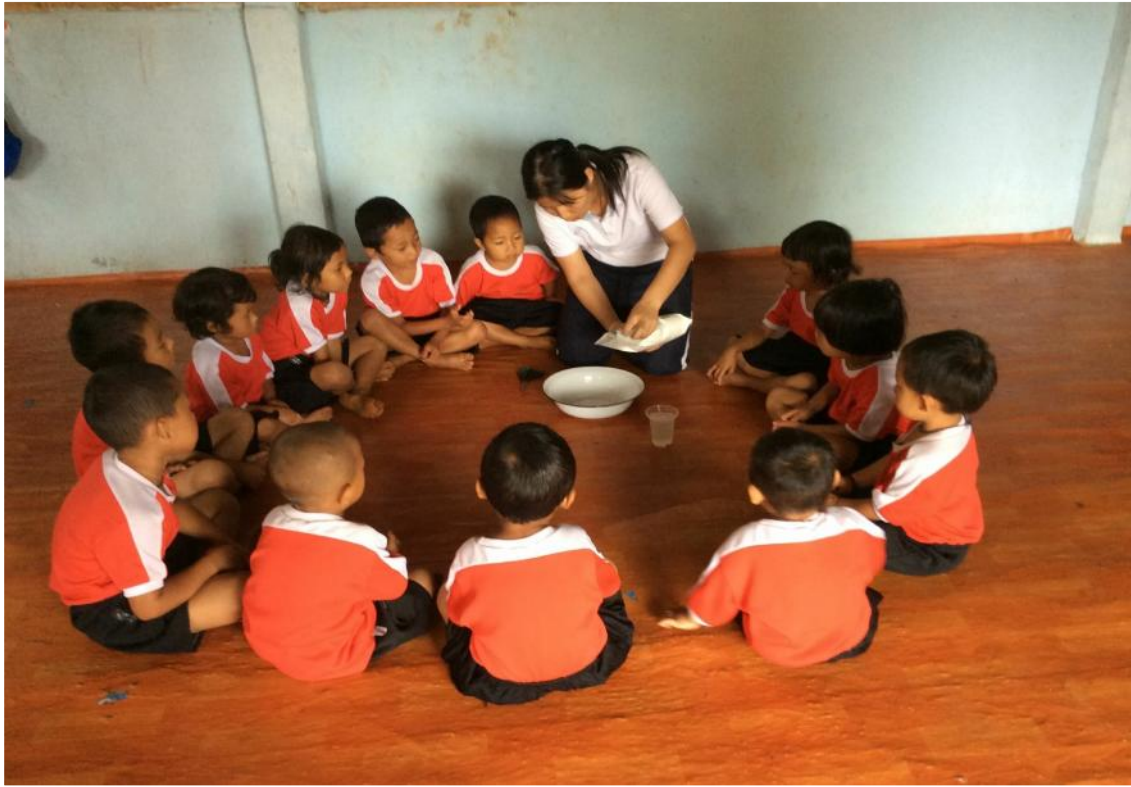
เด็กๆตั้งใจดูครูสาธิตการนวดแป้งมากๆเลย