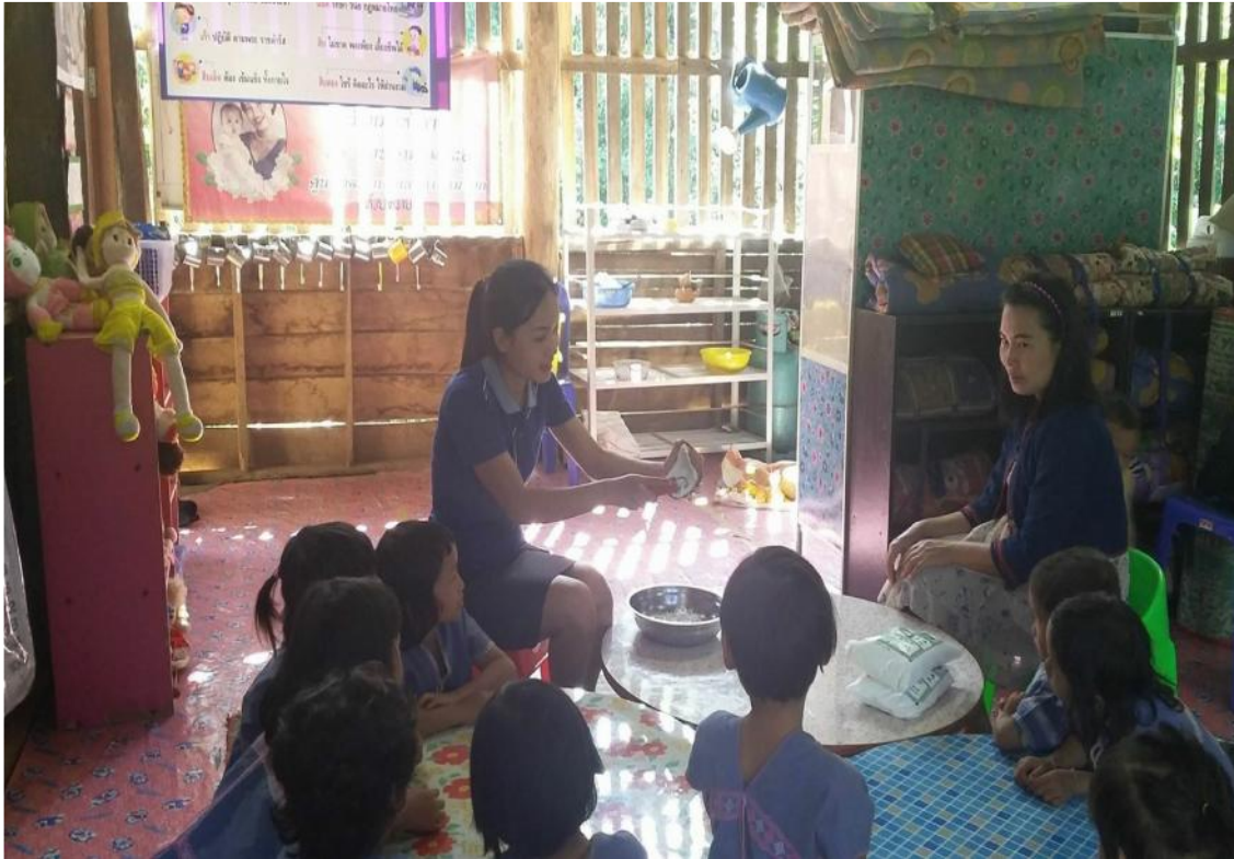
ทำขนมจ็อกเสร็จหนูๆก็ตั้งใจกินกันอย่างอร่อยมาก