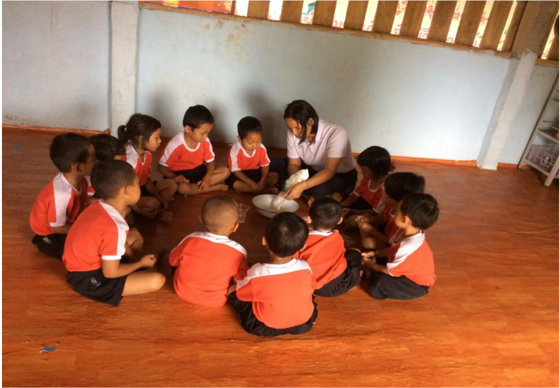
ครูและเด็กๆกำลังนวดแป้งกันแล้วค่ะ