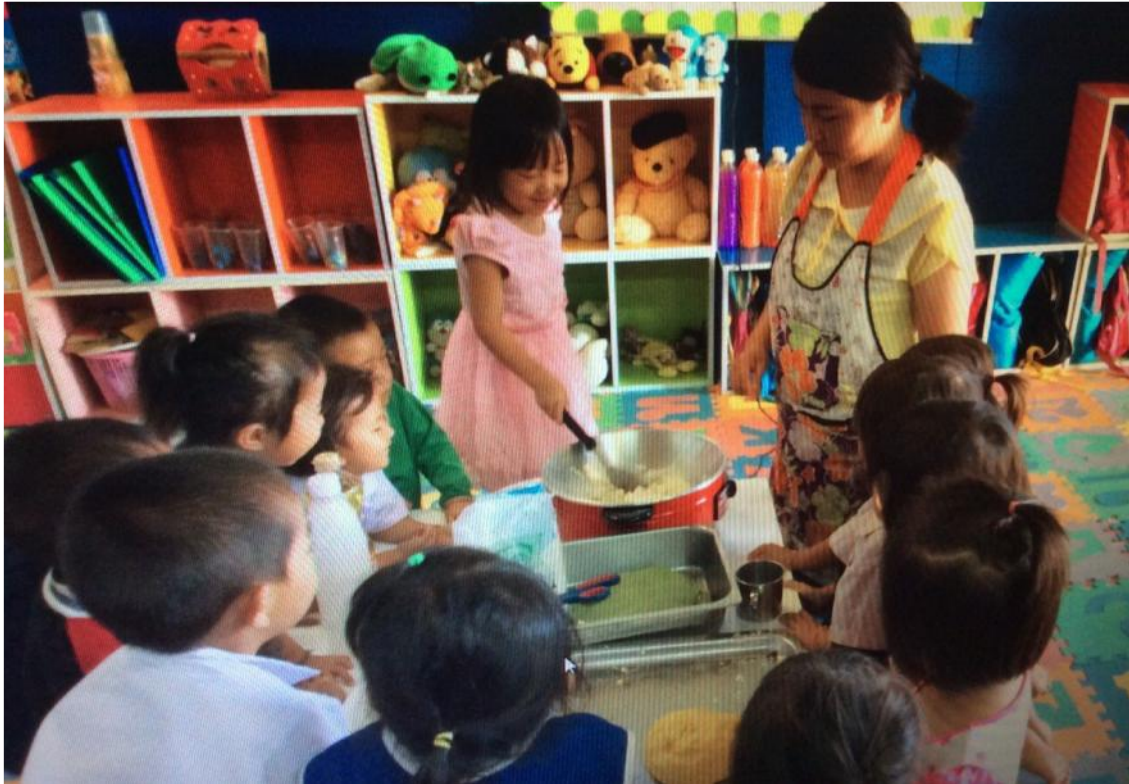
เด็กและครูทำไส้ขนมจ็อก