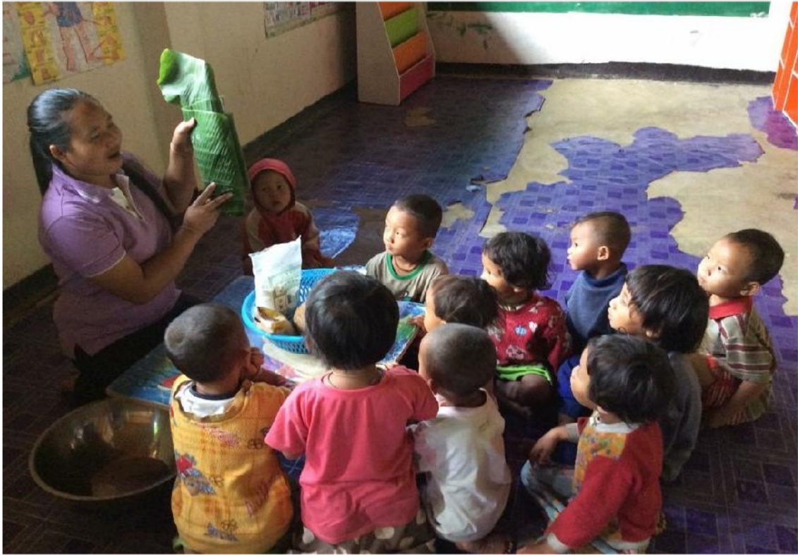
ชั้นแรกครูแนะนำส่วนที่ต้องใช้กับขนมจี้อีกวันนี้