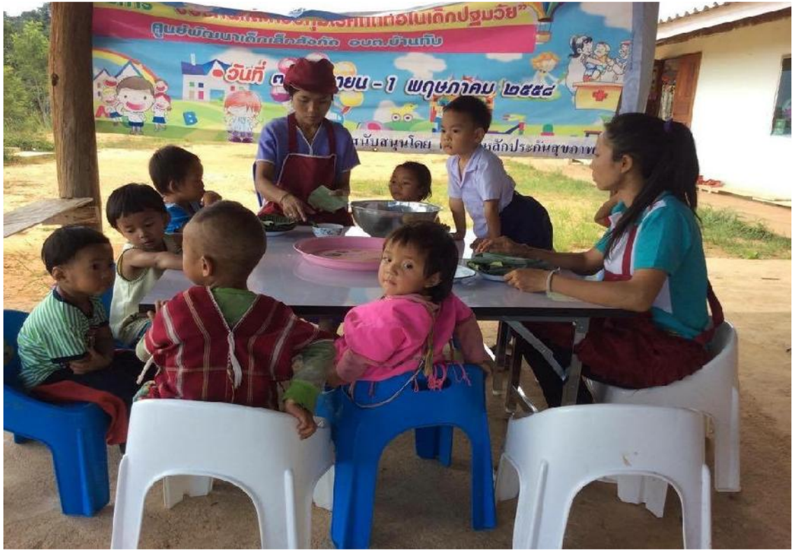
ครูเริ่มสาธิตวิธีการนวดแป้งให้เด็กๆดูกันแล้วค่ะ