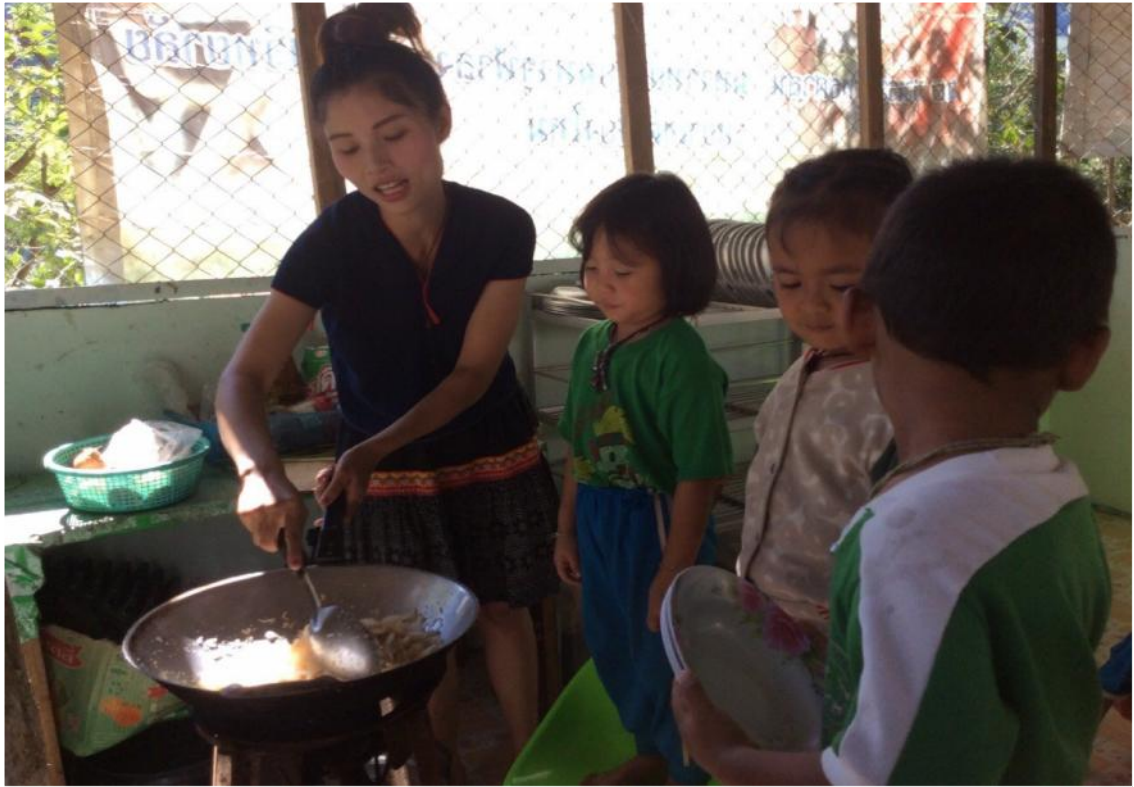
ทำไส้เสร็จพร้อมห่อแล้ว