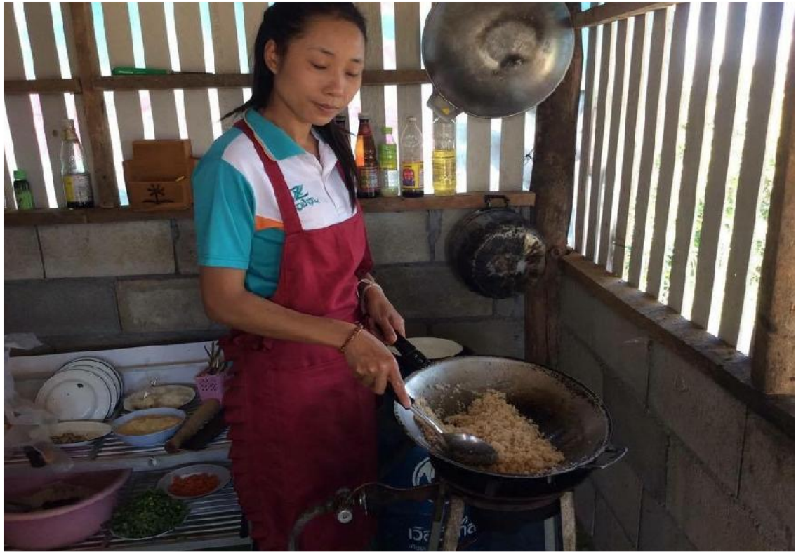
ครูกำลังทำไส้ขนมจ็อกให้เด็กเรียนรู้ด้วยตนเองค่ะ