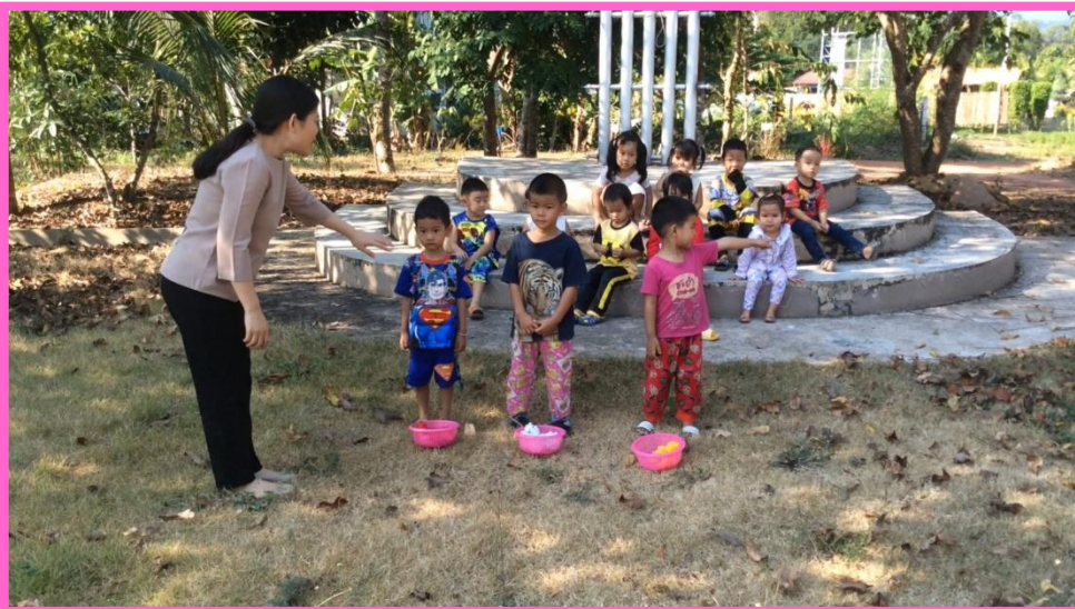
เด็กยืนหน้ากระดาน 3 คน ครูให้ตะกร้าคนละ 1 ใบ (เล่นทีละ 3 คน)