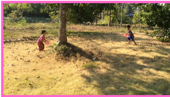
เด็กเล่นเกมวิ่งเก็บดอกไม้ใส่ตะกร้า