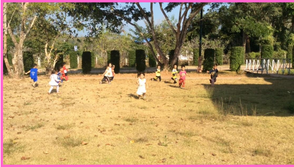
ครูให้เด็กกอบอุ้มร่างกายด้วยการวิ่งไปรอบ ๆ สนาม 1 รอบ