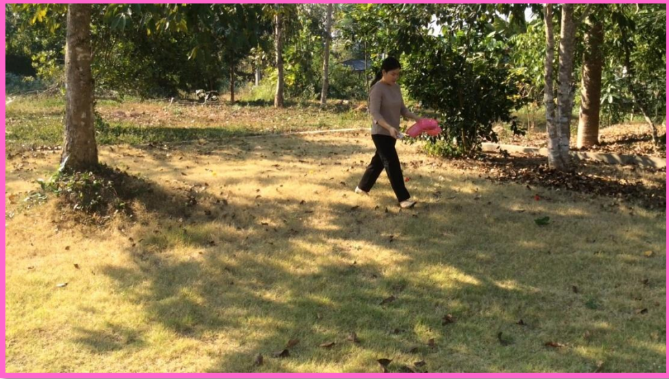
ครูนำดอกไม้สีต่าง ๆ ไปวางทั่ว ๆ บริเวณสนาม