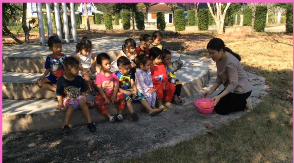
เด็กและครูร่วมกันสรุปถึงกิจกรรมที่ทำ