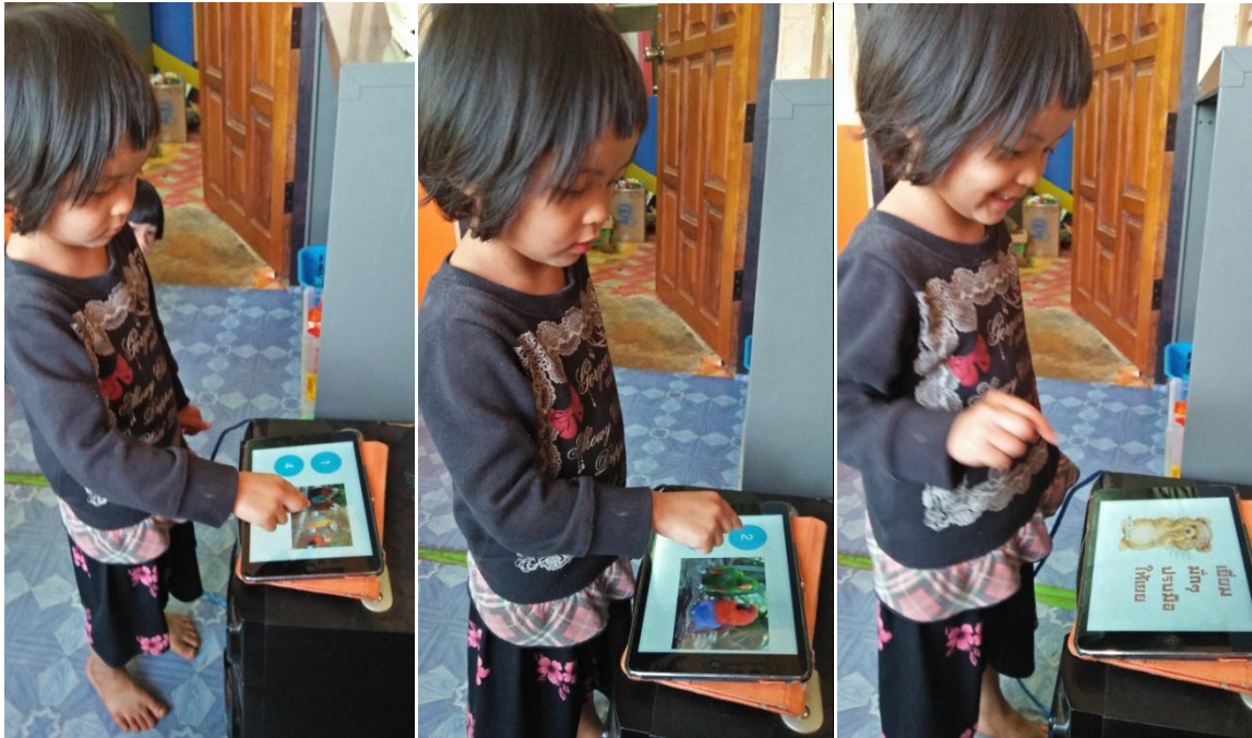
ภาพที่2 กิจกรรมการทดสอบจับคู่จำนวนกับตัวเลข