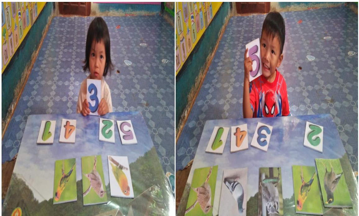
ภาพที่3 กิจกรรมการทดสอบรู้ค่าจำนวน