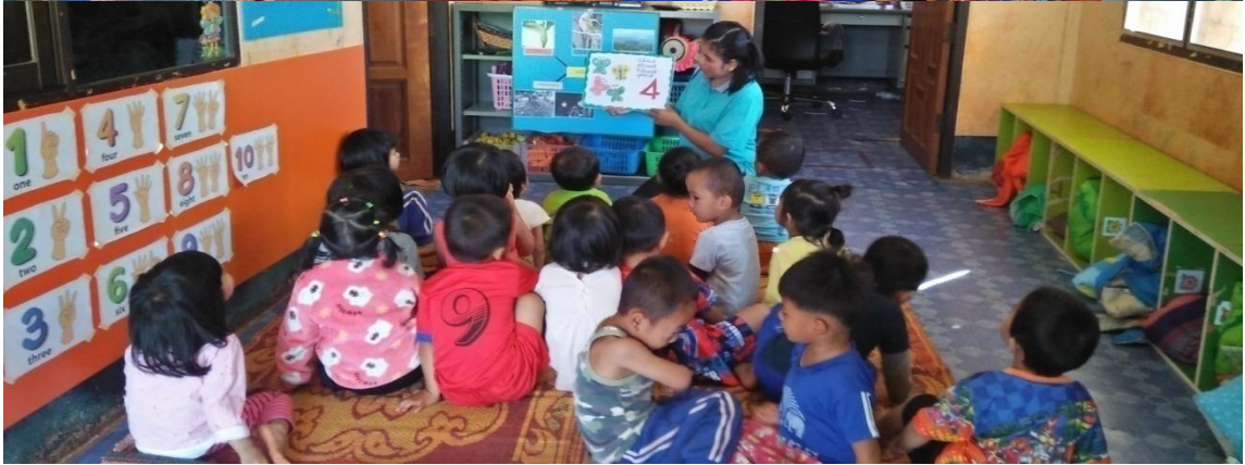
ภาพที่1 กิจกรรมการสอนโดยใช้หนังสือเพื่อนสัตว์นับเลข