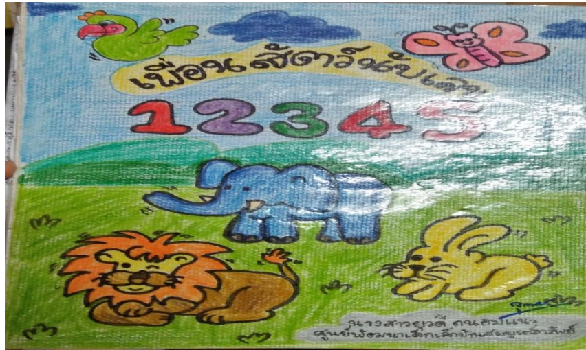
หนังสือเพื่อนสัตว์นับเลข