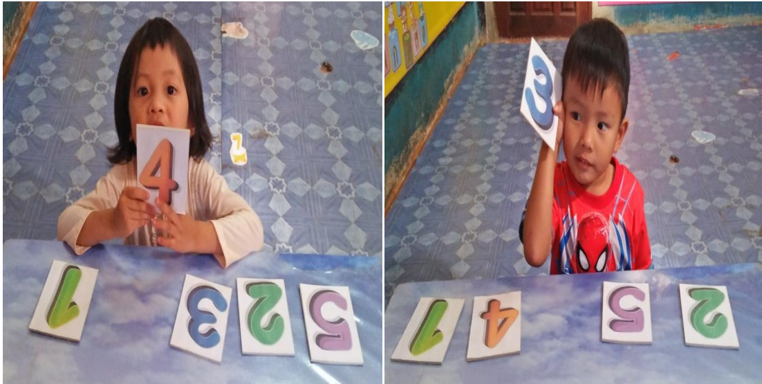
ภาพที่4 กิจกรรมการทดสอบรู้จักสัญลักษณ์1-5