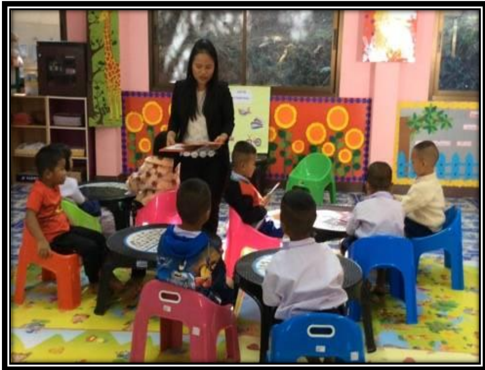
ครูให้เด็กทำใบงาน โยงเส้นภาพคู่กับเงา สนทนาเกี่ยวกับยานพาหนะ