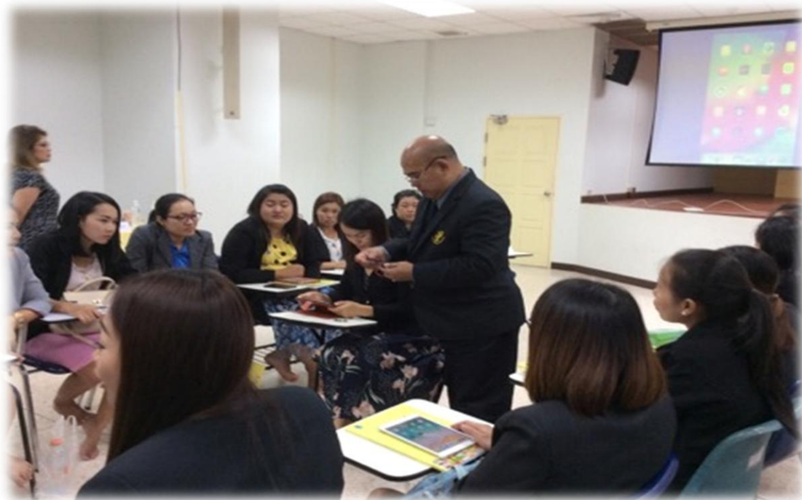
กิจกรรมบอร์ดไมโครคอนโทรเลอร์