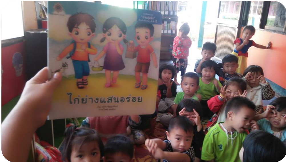
กิจกรรม One Song Hit