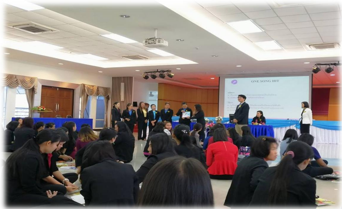
กิจกรรม One Song Hit