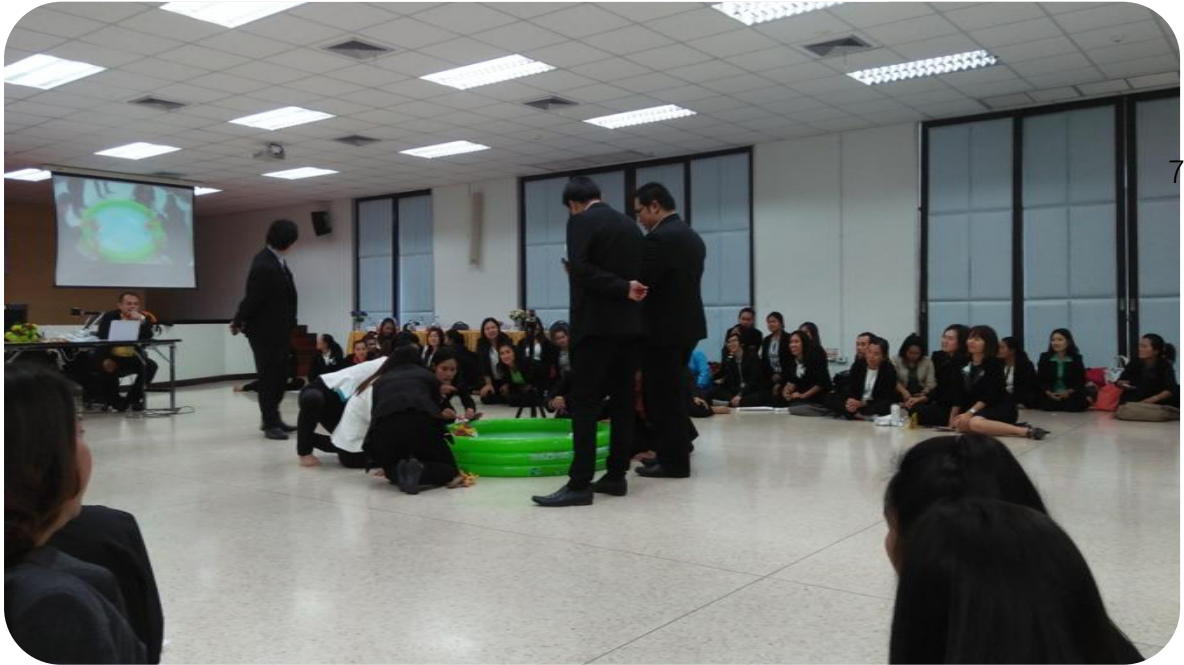
ภาพการเข้าร่วมกิจกรรม