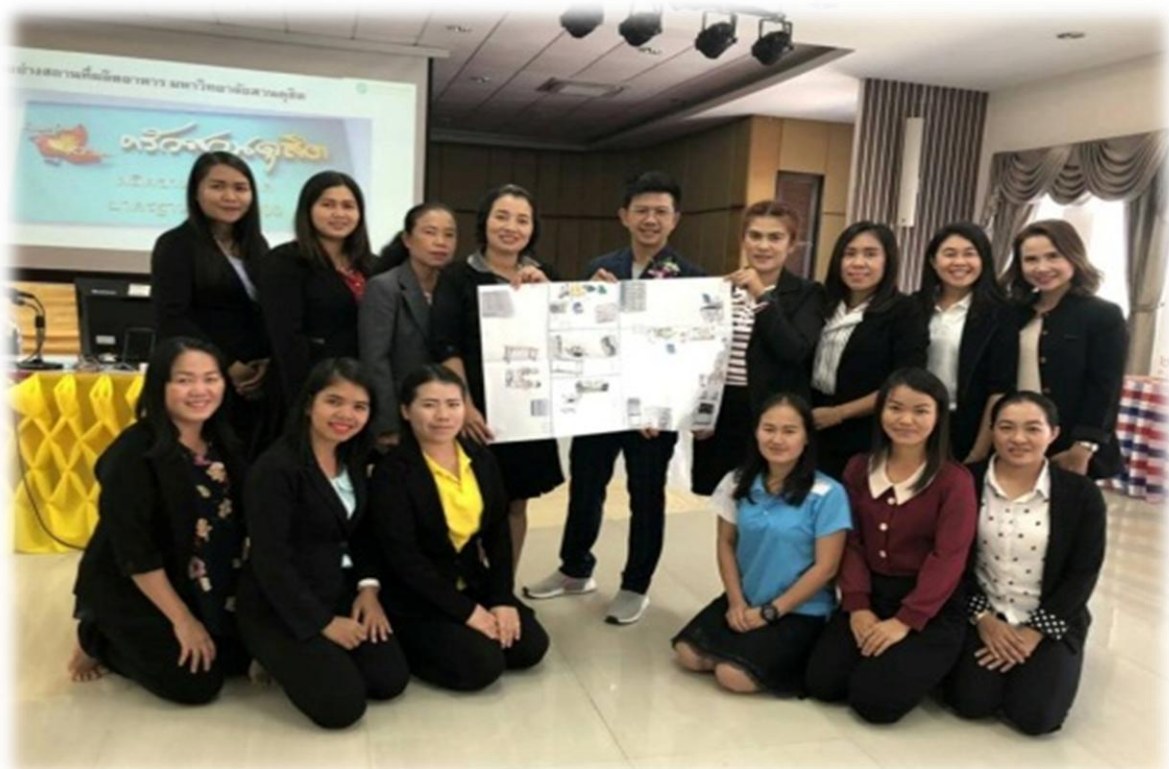
กิจกรรมโรงอาหารในฝันของฉัน