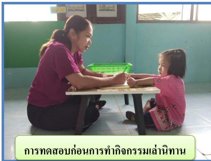
การทดสอบก่อนการทำกิจกรรมเล่นิทาน