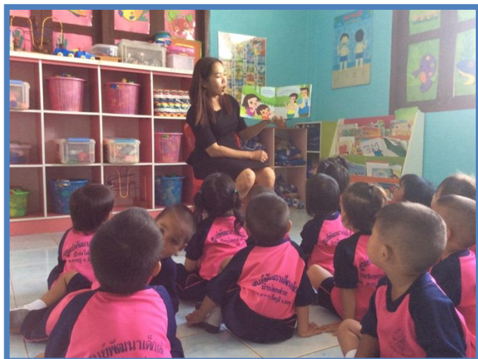
กิจกรรมการเล่านิทาน