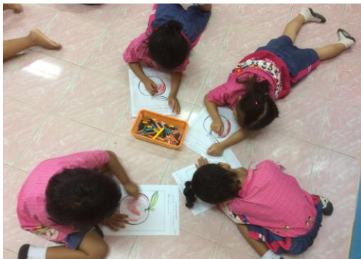
ระบายสีภาพผลไม้ ครั้งที่ 1