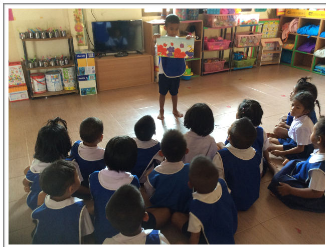
นักเรียนแต่ละคนออกมาเล่าเรื่องจากภาพ ในนิทานที่ตนชอบ หน้าชั้นเรียนทีละคน