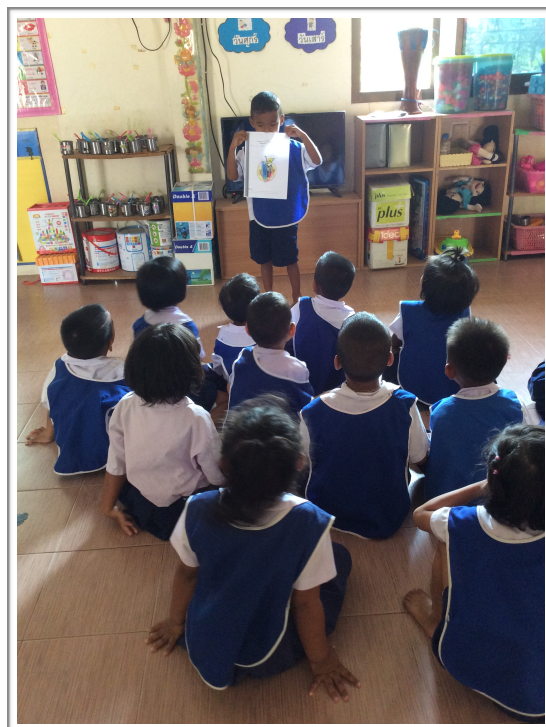
นักเรียนแต่ละคนนำเสนอผลงานที่ตนเองระบายสีเกี่ยวกับผลไม้