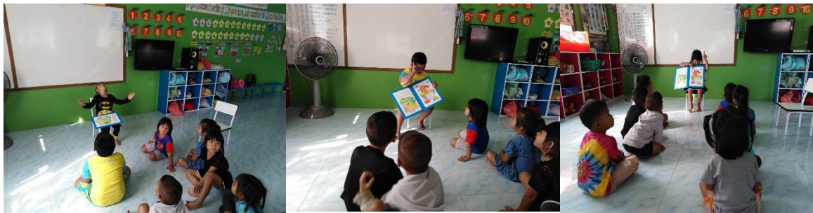
เรื่อง อี๋อ่างกับวัว