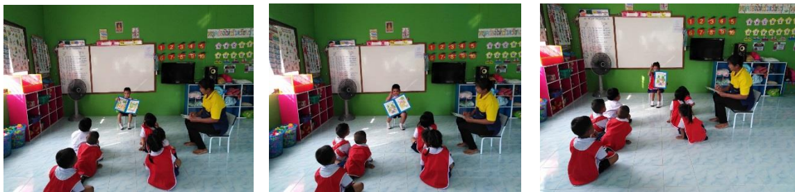
เรื่อง กระต่ายกับเตา