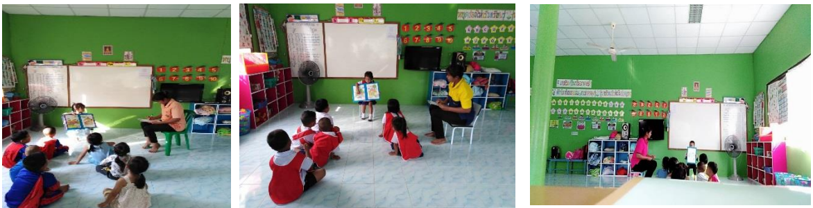
การทำแบบสังเกต