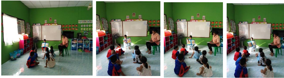
เรื่อง หนากับเงา