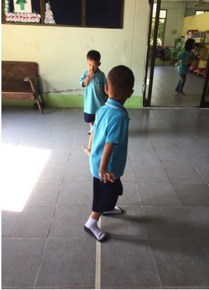
ก่อนจัดกิจกรรมเดินบนเส้นขาว