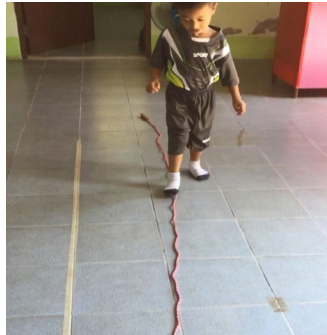
หลังจัดกิจกรรมฝึกเดินบนเชือก