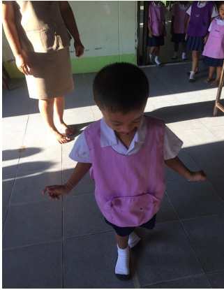
หลังจัดกิจกรรมเดินบนเส้นขาว