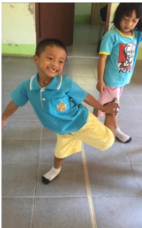
ก่อนจัดกิจกรรมยืนขาเดียว