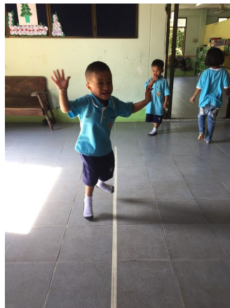
หลังจัดกิจกรรมฝึกกระโดดขา