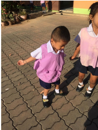
ก่อนจัดกิจกรรมกระโดดขา