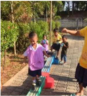
ก่อนจัดกิจกรรมเดินบนกระดานทรงตัว