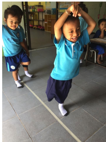
หลังจัดกิจกรรมยืนขาเดียว