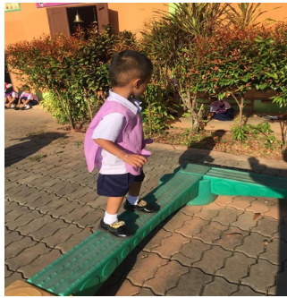
หลังจัดกิจกรรมฝึกเดินบนกระดานทรงตัว