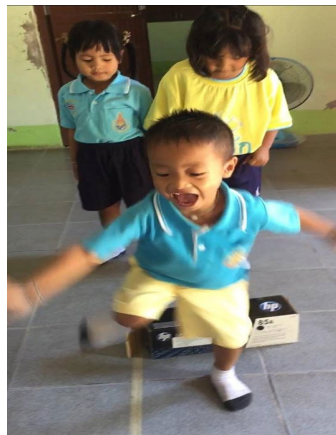
หลังจัดกิจกรรมกระโดดข้ามสิ่งกีดขวาง