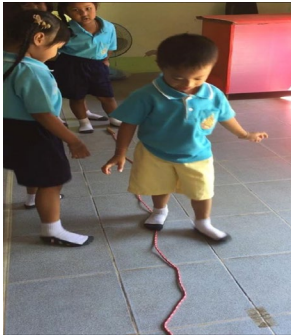
ก่อนจัดกิจกรรมเดินบนเชือก