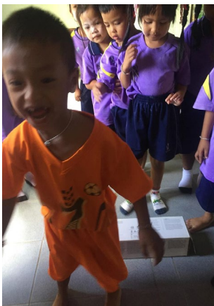
ก่อนจัดกิจกรรมกระโดดข้ามสิ่งกีดขวาง