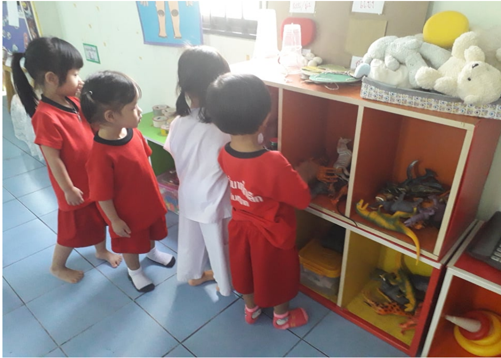
การจัดเก็บของเล่น