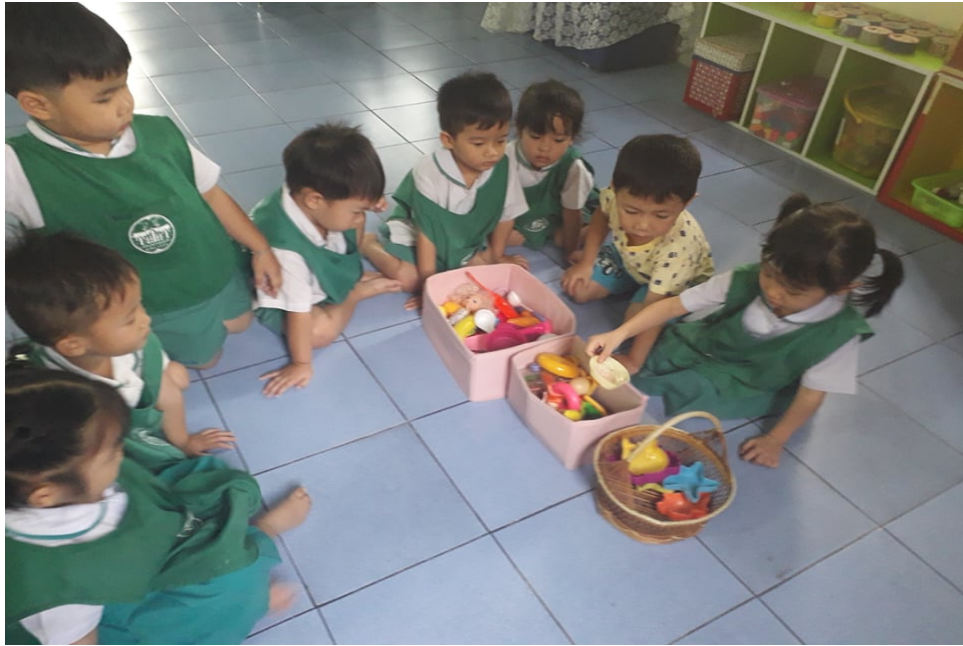
การคัดแยกของเล่น