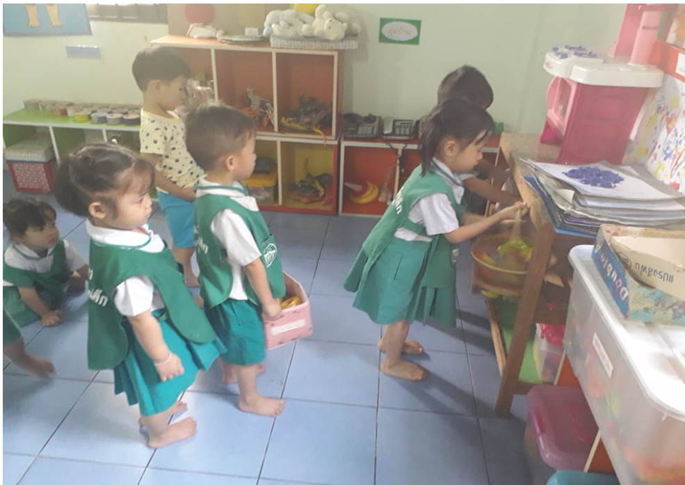
การจัดเก็บเข้ามุม