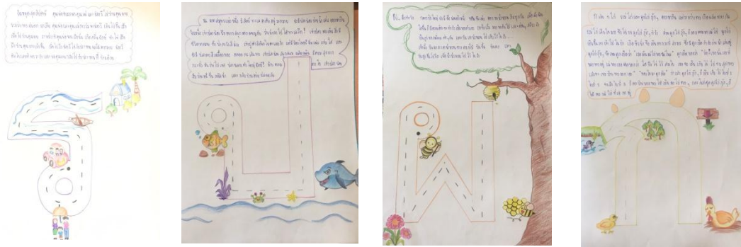
ภาพประกอบ 2 นิทานเล่าไปเขียนไป 4 เรื่อง