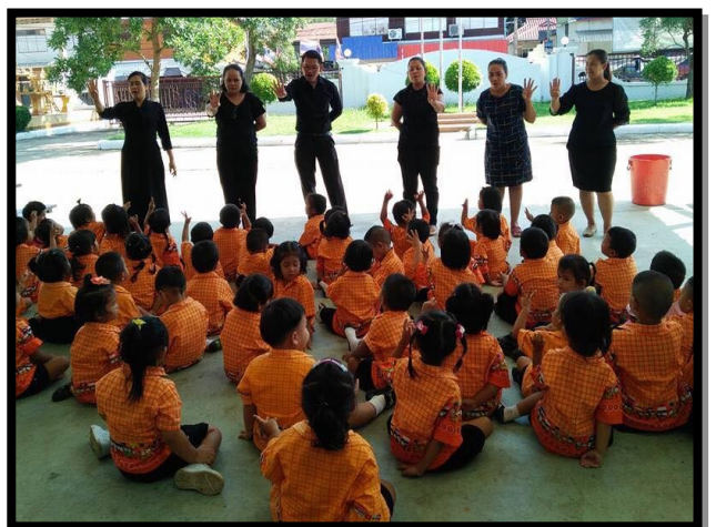
ภาพกิจกรรมการเล่านิทาน