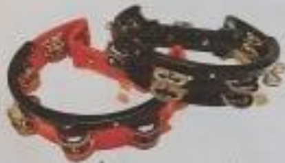
เครื่องเคลือบจิ้งหหวะ