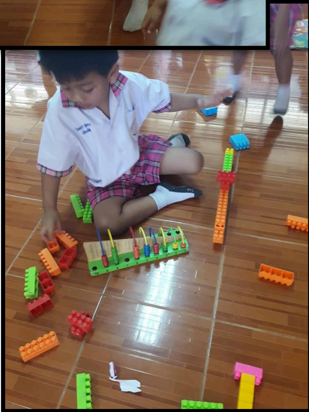
หน่วยการจัดประสบการณ์และสื่อนิทาน