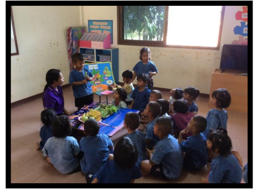
ภาพกิจกรรมที่ 4