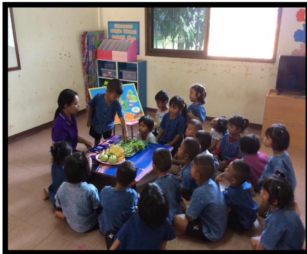
ภาพกิจกรรมที่ 6

กิจกรรมที่ 6 ให้นักเรียนแต่ละคนออกมาเล่าถึงผักที่ตนเองชอบ