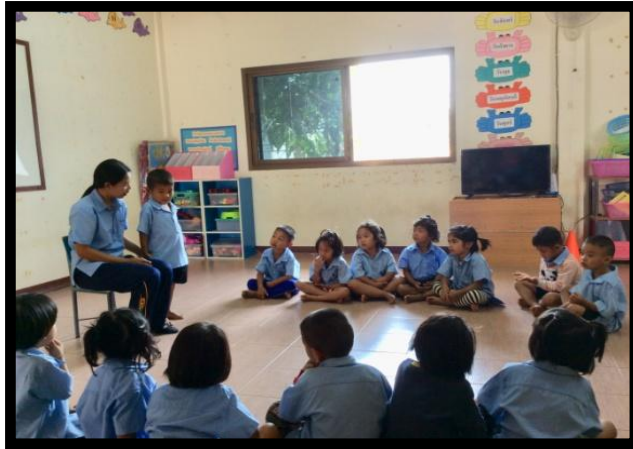
ภาพกิจกรรมที่ 1

กิจกรรมที่ 1 ให้นักเรียนแต่ละคนออกมาแนะนำตัวเองที่ละคนหน้าชั้นเรียน