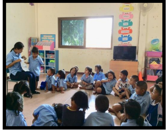
ภาพกิจกรรมที่ 3

กิจกรรมที่ 4 ให้นักเรียนแต่ละคนออกมาเล่าถึงรสชาติของผักและผลไม้ที่ตนเองชอบ