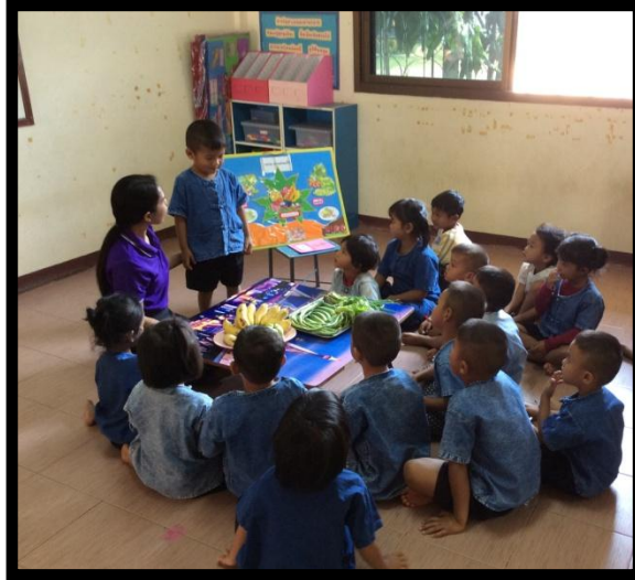
ภาพกิจกรรมที่ 5

กิจกรรมที่ 5 ให้นักเรียนแต่ละคนออกมาเล่าประสบการณ์เกี่ยวกับผัก