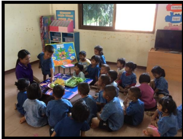
ภาพกิจกรรมที่ 2

กิจกรรมที่ 2 ให้นักเรียนแต่ละคนออกมาเล่าประสบการณ์เกี่ยวกับผลไม้