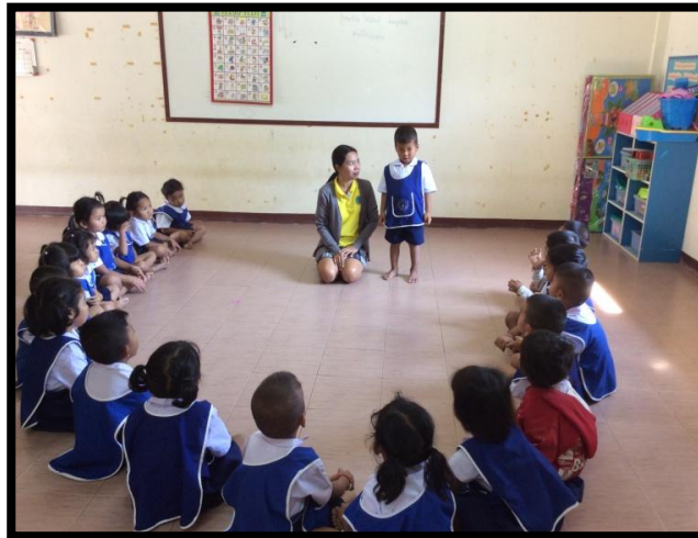
ภาพกิจกรรมที่ 7

กิจกรรมที่ 7 ให้นักเรียนแต่ละคนออกมาเล่าถึงกิจกรรมที่ตนเองได้ทำกับผู้ปกครอง