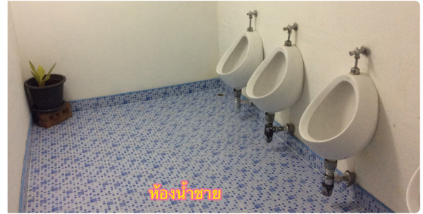
ห้องน้ำชาย

🍁 ห้องอาบน้ำ เป็นห้องอาบน้ำแบบฝักบัว สำหรับเด็ก มีอ่างล้างหน้า 2 อ่าง