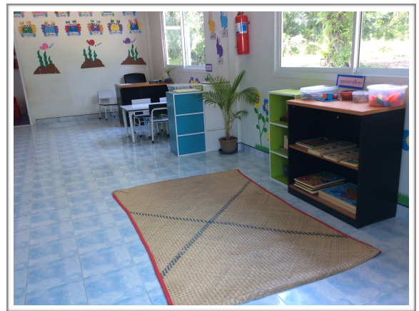
ภาพการจัดสภาพแวดล้อมภายในห้องเรียน