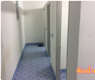
ห้องน้ำหญิง

🍁 ห้องน้ำ ชาย หญิง ห้องน้ำหญิง โถชักโครก จำนวน 3 ห้องขนาดสำหรับเด็กเล็ก ห้องน้ำชายเป็นโถลอย สำหรับปัสสาวะ 3 โถ สามารถกดน้ำได้ขนาดสำหรับเด็กเล็กเช่นกัน