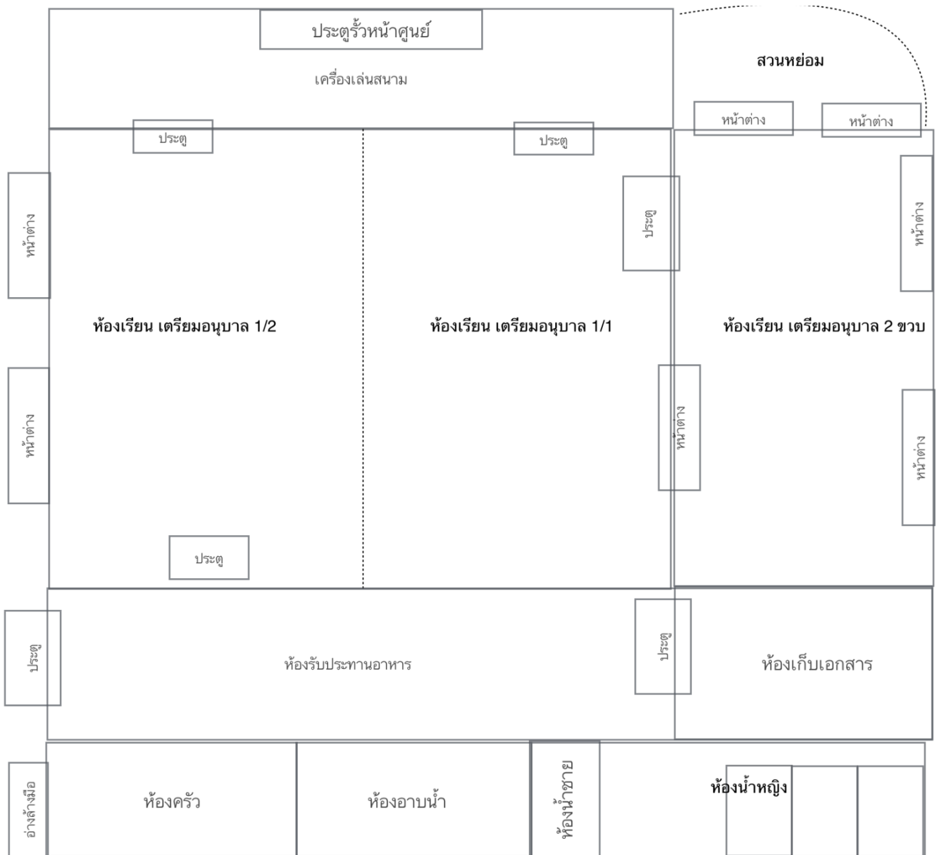
ผังแสดง โครงสร้างอาคารศูนย์พัฒนาเด็กเล็กบ้านทรายขาว