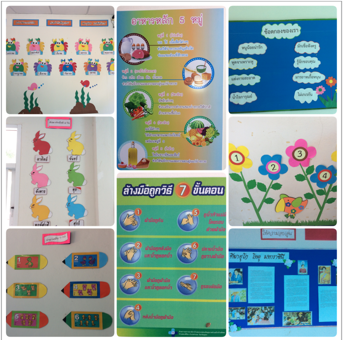
ภาพป้ายนิเทศภายในห้องเรียน

ป้ายนิเทศภายในห้องเรียนที่ส่งเสริมการเรียนรู้ เช่น จำนวนนับ ตัวเลข ข้อตกลงของชั้นเรียน วันทั้งเจ็ด เดือนทั้ง 12 เดือน อาหารหลัก 5 หมู่ 7 ขั้นตอนการล้างมือ และผลงานของเรา