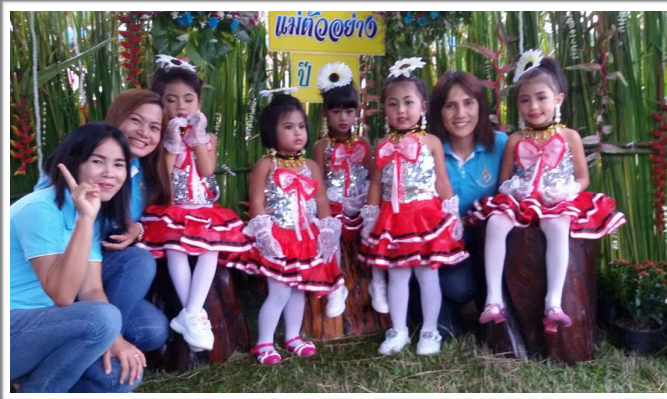
ร่วมกิจกรรมวันแม่แห่งชาติกับหมู่บ้าน