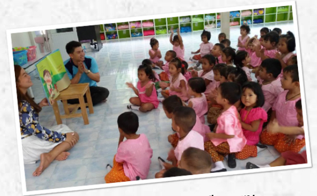
โครงการครูสอนศิลปกรรม