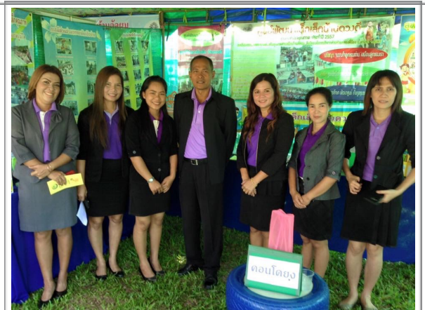
ร่วมจัดนิทรรศการสุขภาพกับ รพสต ประจำตำบล