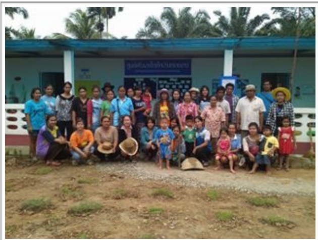
ร่วมกิจกรรมปรับปรุงภูมิทัศน์