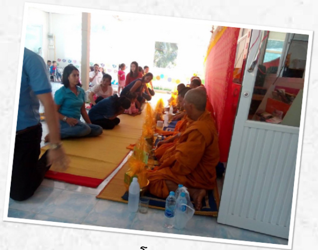
โครงการทำบุญวันปีใหม่