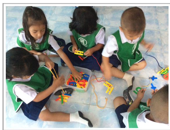
ภาพการจัดกิจกรรมการจัดการเรียนรู้