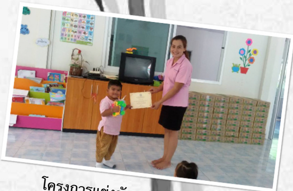
โครงการแข่งขันระบายสี