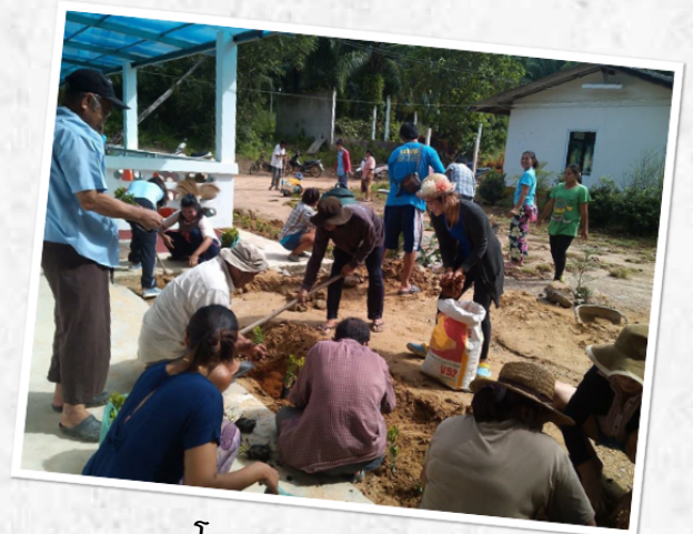
โครงการปรับปรุงภูมิทัศน์