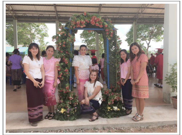
ร่วมกิจกรรมสืบสานวัฒนธรรม โรงเรียนในชุมชน