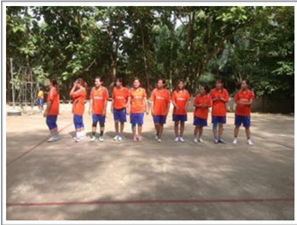
ร่วมกิจกรรมกีฬาตำบล