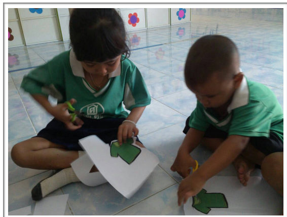
ภาพการจัดกิจกรรมการจัดการเรียนรู้