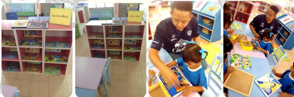
ภาพหลังจัด

การนำวัสดุพื้นบ้านมาประยุกต์ใช้ในการจัดมุม การจัดทำสื่อโดยใช้เมล็ดพืชจากท้องถิ่น ความเหมาะสมกับวัย เหมาะสำหรับเด็ก 2-5 ขวบ