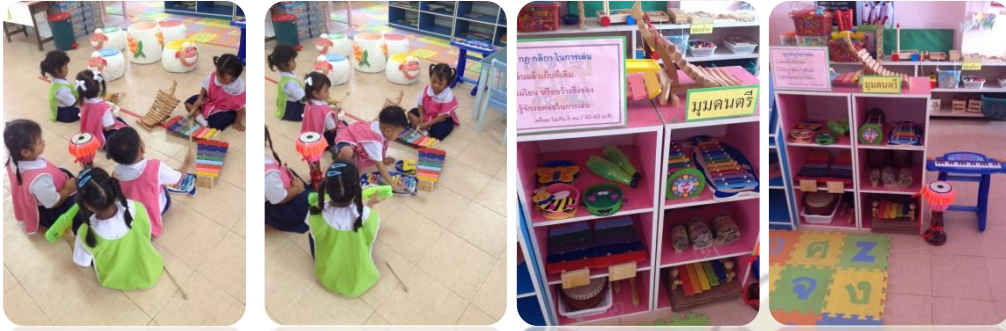
ภาพหลังจัด

การนำวัสดุพื้นบ้านมาประยุกต์ใช้ในการจัดมุม การใช้เครื่องดนตรีที่ทำมาจากวัสดุ ท้องถิ่น เช่น ไม้ไผ่ หนัง วั้ว วัสดุเหลือใช้ต่างๆ