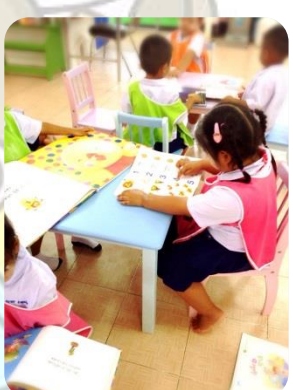
ภาพหลังจัด