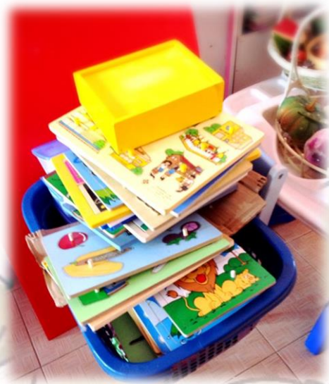
ภาพก่อนจัด

- เกมจับคู่ ภาพตัดต่อ จัดหมวดหมู่ เกมวางภาพต่อปลาย(โดมิโน) เกมเรียงลำดับ