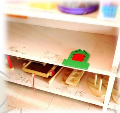
ภาพก่อนจัด