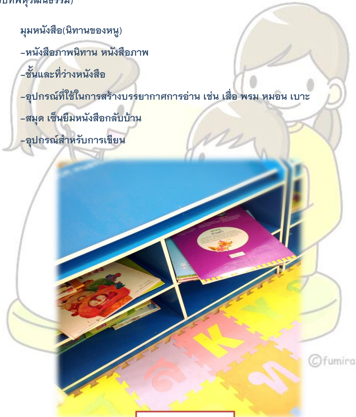
ภาพก่อนจัด