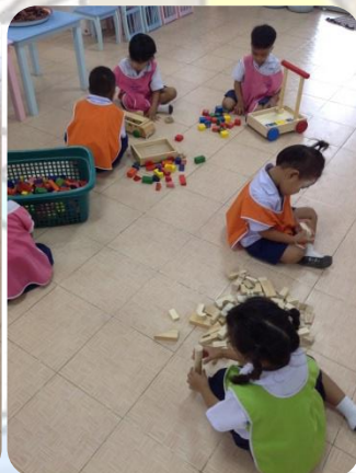
ภาพหลังจัด

การนำวัสดุพื้นบ้านมาประยุกต์ใช้ในการจัดมุม การใช้ลังนมที่หมดแล้ว มาทำเป็นบล็อกตัวต่อ นำเศษไม้ที่เหลือจากโรงงานเฟอร์นิเจอร์ในหมู่บ้านมาทำบล็อก