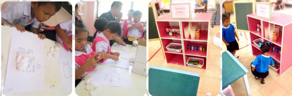
ภาพหลังจัด