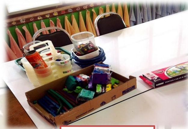
ภาพก่อนจัด