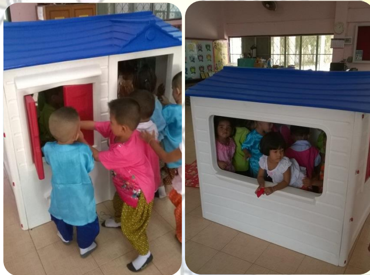
ภาพก่อนจัด

-อุปกรณ์ประกอบการเล่น เช่น เครื่องคิดเงิน ธนบัตร เหรียญจำลอง