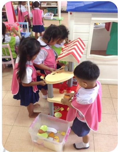
ภาพหลังจัด

กฎ กติกา ในการเล่น 1. เล่นแล้วเก็บที่เดิม 2. ไม่โยน หรือขว้างสิ่งของ 3. รู้จักรอคอยในการเล่น (ครั้งละ ไม่เกิน 6 คน / 40-60 นาที)