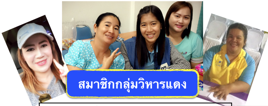
สมาชิกกลุ่มวิหารแดง